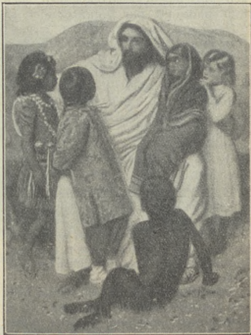
Se, alla ha kläder utom vi.

S edan pojkarna nu arbeta hela dagen, så ha de fått mera betalt. De allra flesta ha för sina besparingar köpt sig en tygbit, och en sykunnig svarting har fullt jobb att sy kläder åt dem. Du må tro, att de äro belättna att få dra på sig den första skjortan. De små parvlarna ha hittills aldrig ägt en sådan och nu är glädjen ofantlig. Vi ha en liten tavla i verandan som föreställer Frälsaren med ett barn av varje folkslag omkring sig. Ett litet hindubarn har han lyft upp på sitt knä och runt omkring honom står sedan de övriga. Där är en liten kinesflicka, en liten indian och en liten ljuslett europeisk flicka, och vid hans fötter sitter en liten mörk negerpojke. Det skall föreställa huru Jesus, barnens vän, älskar alla barn, vilken hudfärg de än ha. Alla se glada och lyckliga ut, och alla ha de kläder på sig utom negergossen. Om du visste, huru våra