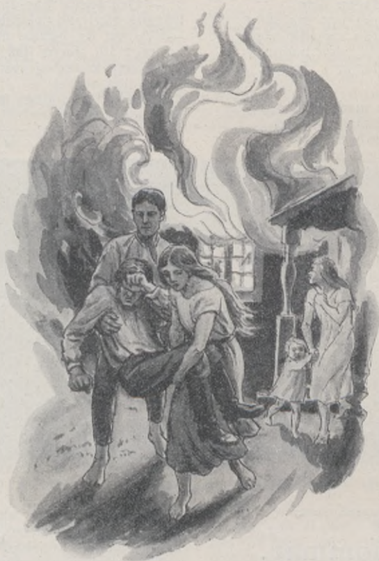
”De lade honom varsamt på gräsmattan.”