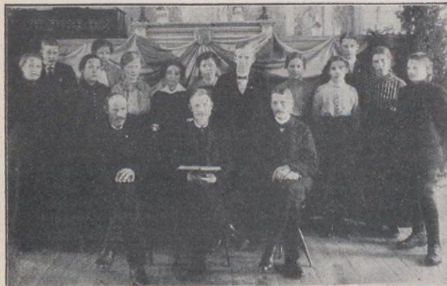
Gysinge kr. ungdomsförening.