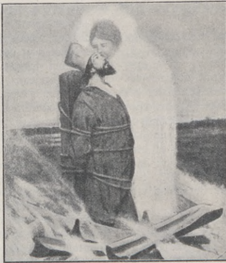
Hus på bålet.

åt den världsliga makten för att straffas till livet. Man avklädde honom den prästerliga dräkten och satte på hans huvud en pyramidformig pappersmössa, på vilken tre djävlar voro målade och med inskriften: hic est hæresiarcha (»denne är kättarhövdingen»). Biskoparna sade till honom: »Vi överlämna din själ åt djävulen». Hus svarade: »Jag anbefaller den i vår Frälsares Jesu Kristi händer.» Därpå befallde borgmästaren stadstjänarna och skarprättaren, att de skulle föra ut honom.