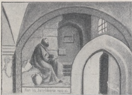
Hus i fängelset.

Den stora, avgörande brytningen mellan Hus och den påvliga myndigheten inträffade först 1412, då den beryktade påven Johan XXIII lät sälja avlat till förmån för ett krig med konung Ladislaus av Neapel, som hyllat motpåven Gregorius XII. Detta upprörde Hus i hans innersta. Liksom Luther ett århundrade senare så fann sig nu Hus av sitt samvete tvingad