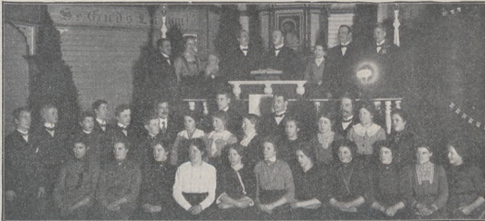
By södra ungdomsförening.

Gästriklands kristl. ungdomsförbund höll sin årshögtid i Hofors lördagen och söndagen