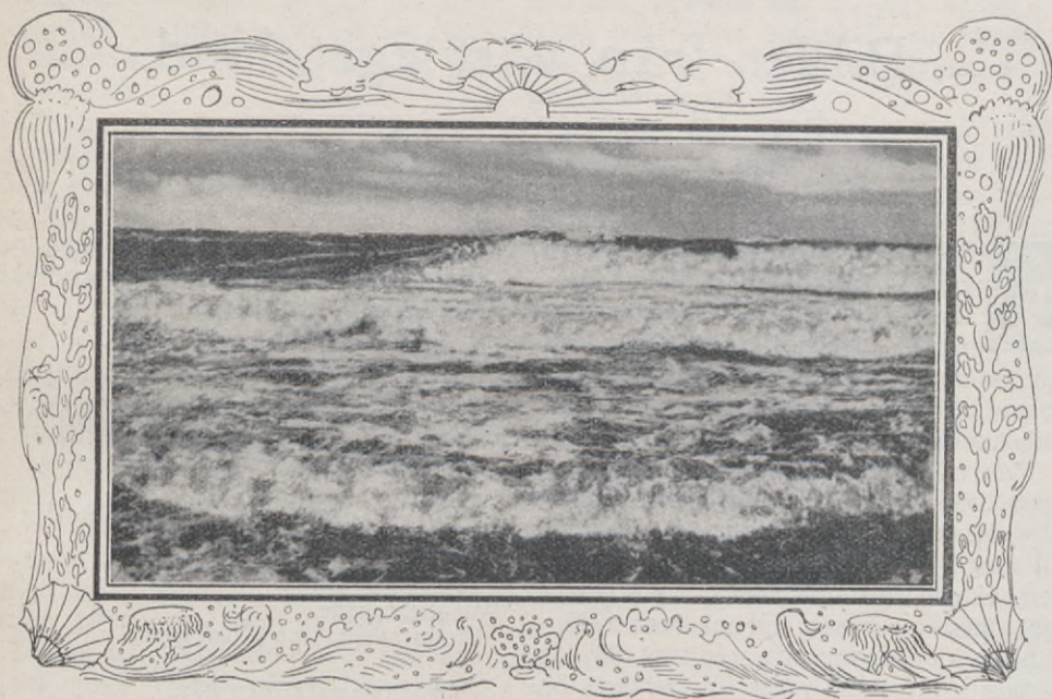
Storm på Östersjön.

Berättelserna från den tiden veta att tala om en så stor folkökning på ön, att