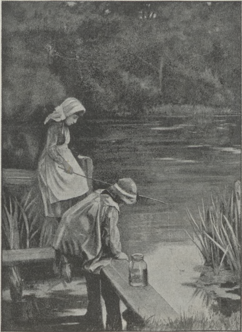
HANS OCH GRETA.