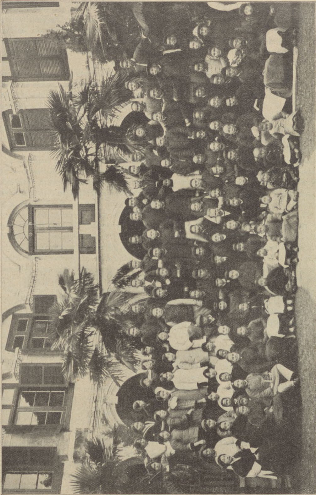
Från minneshögtiden vid Hwangchow. Se föreg. sida.