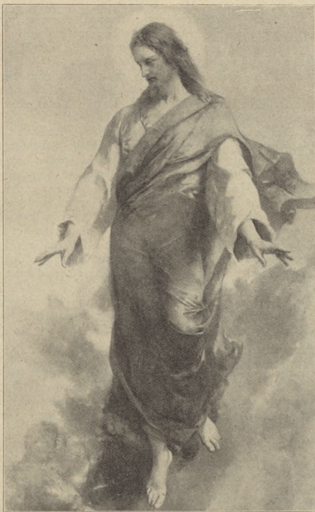
Medan han välsignade dem, försvann han ifrån dem och blev upptagen till himmelen.

Innehåll: Studier i skriften. — Själsstrider. — Minneshögtid vid Hwangchow. — I växlingarnas värld. — Palm och törne. — Ditt hjärta och synden. — E. G. Hjerpe. — Söndagsord. — Från styrelsemötet. — Predikantmöte. — Söndagsskolkurser. — Generalkonferensen och årsmötet. — Annonser.