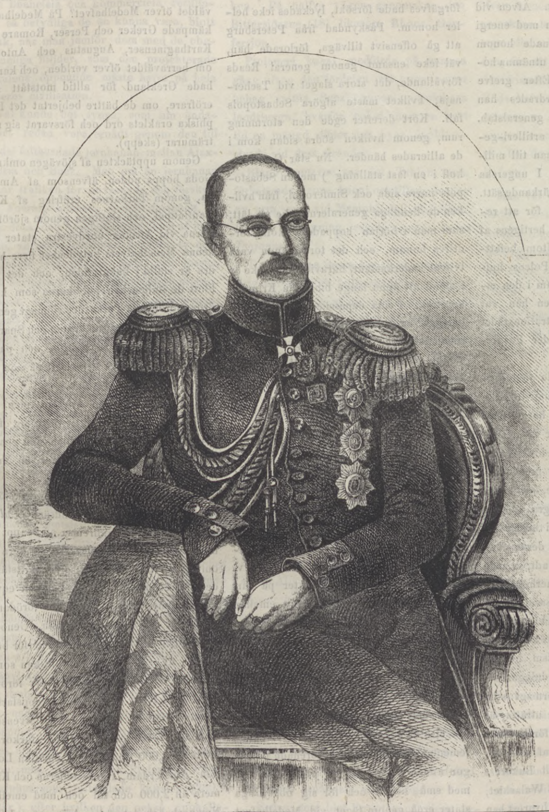
Generaladjutant furst Michael Dimitri Gortschakoff.

N:o 5. Ut kommer hvarje Söndag. Göteborg den 27 Januari 1856. Pris för år: 6 R:dr 32 sk. B.co. X årgången