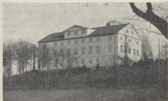
Den nya skolbyggnaden.