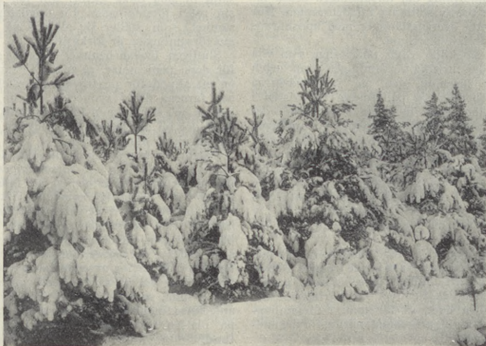
Unga tallar i vinterdräkt.