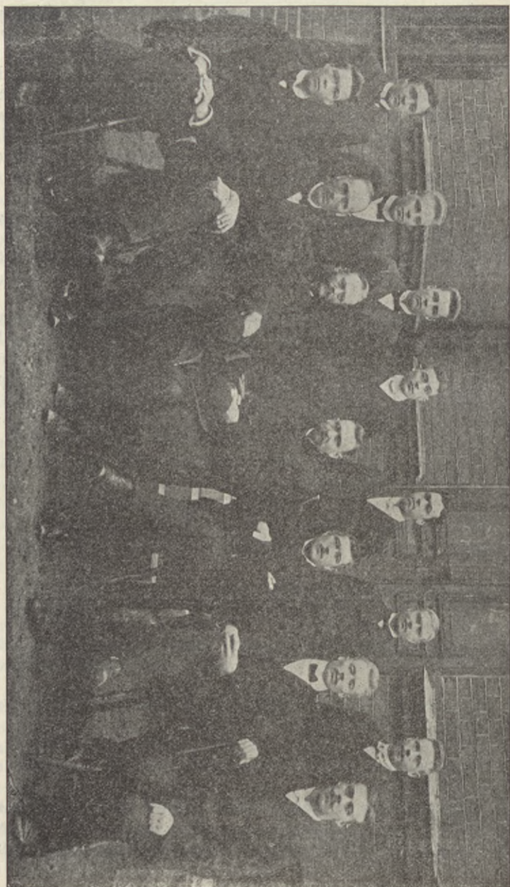
Evangelistkursen i Örebro.