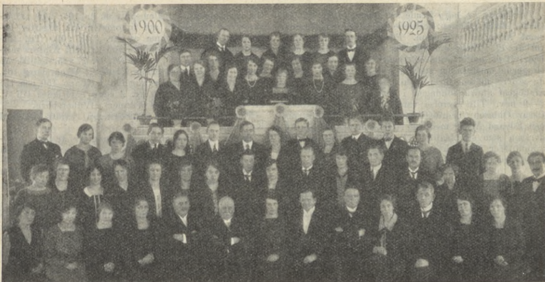
Nyköpings mfgs udfg vid 25-årsjubileet.