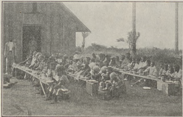
Skolbarnens fäst vid Mbanza-Vivi.

Trettiosju gossar och trettiotre flickor äro inskrivna i skolan, och som ni se av