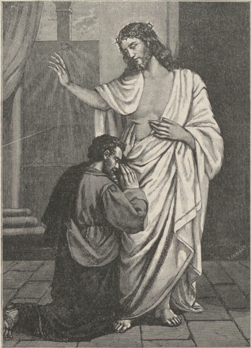
MIN HERRE OCH MIN GUD!