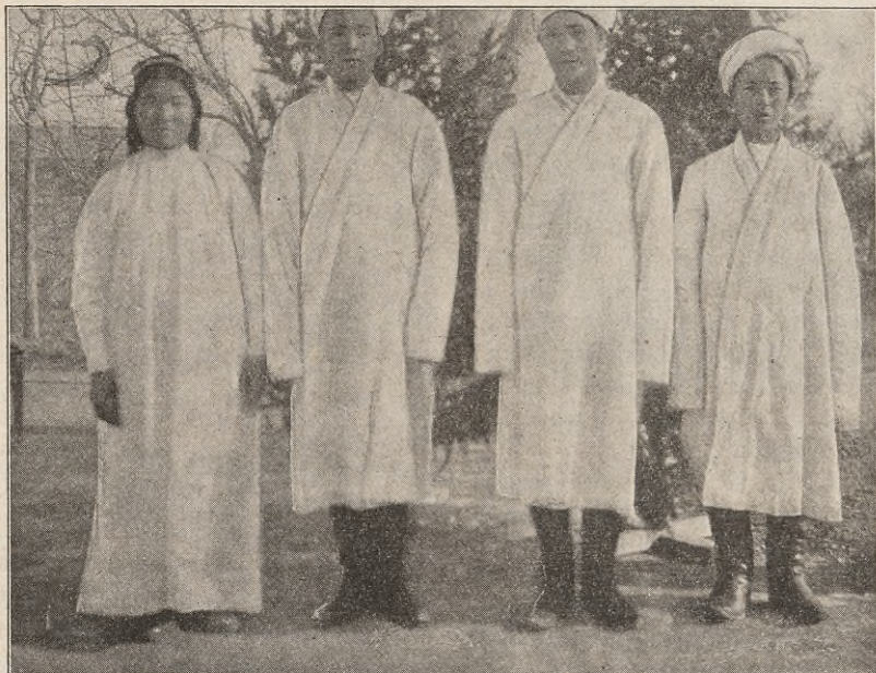
FRÅN DOPHÖGTIDEN I KASHGAR.

Deras resa till hemlandet skulle gå över Indien. Men för att komma dit från Ost-