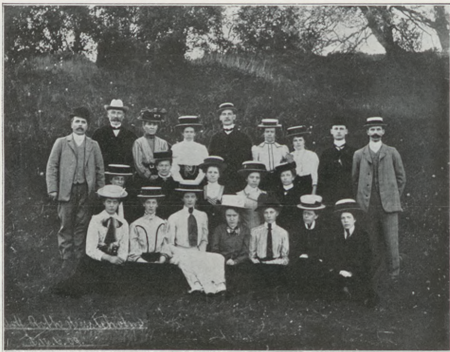
Hessleholms Kristl. Ungdomsförening.

gar som största delen av året vistas där. I förlitande på Herrens hjälp grepo de unga sig an och anordnade ett soldathem, som är beläget alldeles invid kasernen. Omkostnaderna för hemmet uppgå till 7- å 800 kr. pr år, ett avsevärt belopp i förhållande till medlemmarnes antal, men Herren har hulptit, så att hemmets verksamhet ostört kunnat uppehållas.