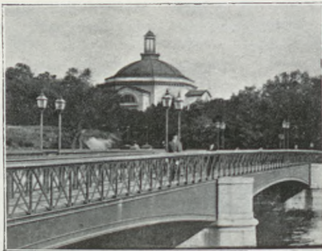
Skeppsholms kyrka, Stockholm.