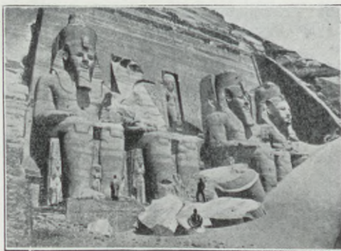
Vy av klipptemplet vid Abú Simbel, byggt av Ramses II år 1330 före Kristus till minne av hans seger över hetéerna.