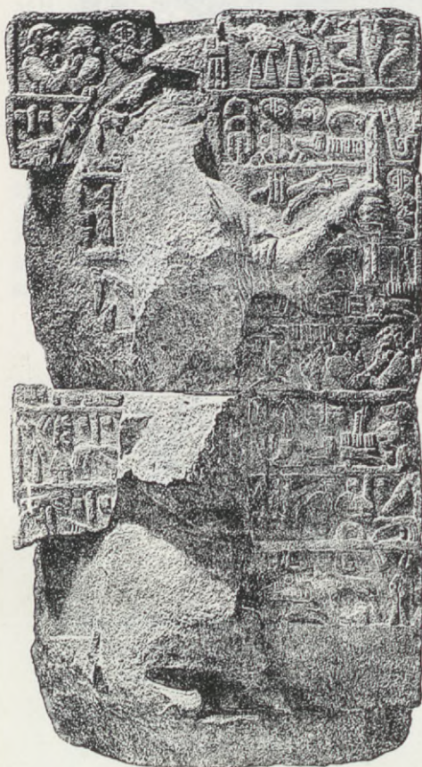
Monument av en hetéerkonung jämte inskriptioner, tecknade medels hieroglyfskrift.

Ända tills för omkring 30 år sedan kände historieskrivare och fornforskare ej något mera om detta folk. Professor Sayce säger därom i ett av sina arbeten: