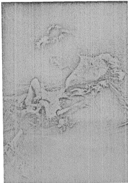
FRAMTIDSDRÖMMAR av Tony Tollet.

Människan skall, under förutsättning att tillfredsställandet av hennes drifter icke tillfogar någon annan skada eller nackdel, bestämma över sig själv. Ingen