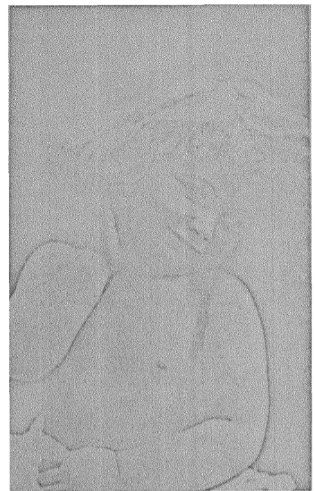
»Mors lilla flicka.»

Hon är en fanatisk motståndare till kvinnornas förvärvsarbete. Det medför ju något så tråkigt som att ens mor har en bestämd arbetstid då hon icke må störas. Det går icke att ropa opp: »Mor, kasta ner mina vantar!» eller: »Mor, jag vill gärna ha mitt hopptåg!»