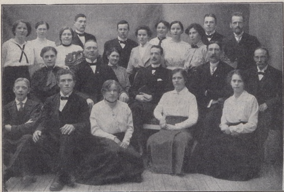
Ungdomsföreningen Tro och hopp, Askersund.

ningens sekreterare m. fl. Dessutom förekom samtal över åtskilliga frågor rörande den troende ungdomen och dess arbete för Herren, varjämte diskuterades ett förslag angående bildandet av en ungdomskrets för traktens ungdomsföreningar. Något beslut