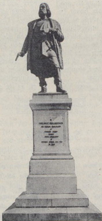
Engelbrektsstatyn i Örebro.

Genom den s. k. Kalmarunionen var Sverige förenat med Danmark och Norge till ett enda rike. Över de tre länderna regerade Erik av Pommern, den danske konungen, en maktlysten och samvetslös vekling. Han gjorde allt för att undertrycka vårt land och böja det under Danmarks alltmera övertagande välde. Det är nästan rörande att höra talas om den djupa förnedring, Sverige befann sig i på den tiden. Mot eden, konung Erik svurit det svenska folket, att »rike sitt styra med inländska män och ej utländska», insatte han danskar och tyskar till fogdar och slottsherrar i vårt land. Redan detta var ju ett groft brott mot rätt och lag. Men