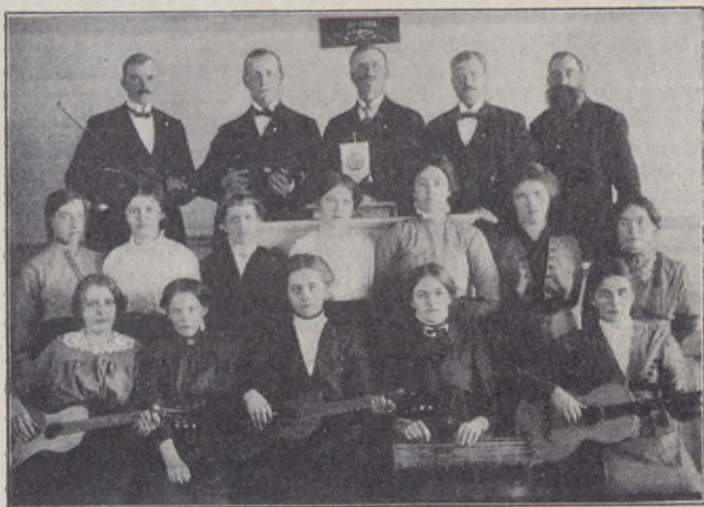
Särna kristl. ungdomsförening.

Särna kristl. ungdomsförening , som härmed presenteras för U. F. V:s läsare, bildades i januari 1909, då 15 medlemmar ingingo i densamma. F. n. är medlemsantalet 31. Föreningen är ansluten till Dalarnes Ansgarieförenings ungdomsförbund samt till S. M. U.