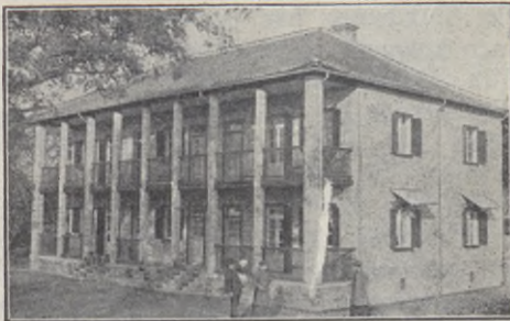
Miss onsstationen i Macheng.

Vi rådgjorde först en stund med varandra, min man och jag, och beslöto, att, om de voro villiga därtill, skulle hon få bo i sjukstugan, och vi skulle göra, vad vi kunde,