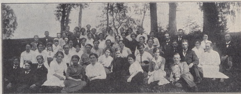
Hjo brödräfsamlings ungdomsförbund.

• Ungdomsklassen, Borås. Det var en strålände glad skara ungdom i åldern 13—17 år, som samlades till invigning av sitt nya gemensamma "ungdomshem" sönd. den 19 sept. kl. 7 e. m. i Immanuelskyrkan i Borås. Inte var det underligt, att glädje lyste i allas ögon — deras önskan att få ett "juniorhem" eller