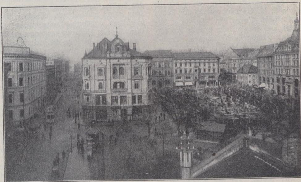
Carl Johansgatan och Stortorget i Kristiania.

Detta höll sitt tredje årsmöte tillsammans med Förbundets på samma sätt, som det plägar ske här hemma i Sverige.