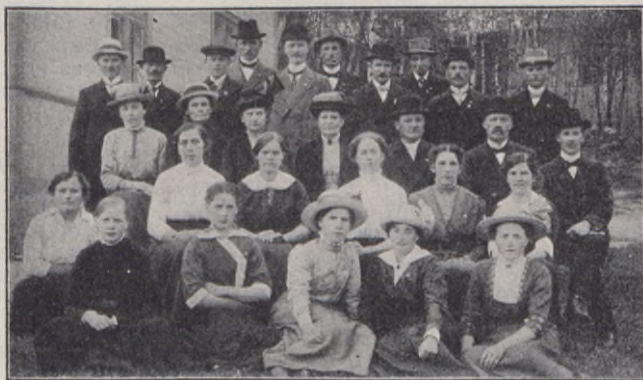
Björklinge kr. ungdomsförening.

"ungdomshem" till stånd hade ju gått i fullbordan. Enkelt och anspråkslöst är det — består blott av ett större rum med