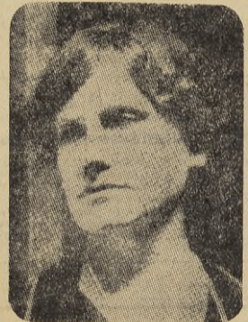
Mrs Nellie Tayloe Ross, chef för myntverket i Washington.

Det mod som presidenten visat då han utan alla traditioner vågat utnyttja den kvinnliga kraften i så höga uppfiger, får ytterligare glans, när man hör, att några av ledarna för arbetarorganisationer i Förenta Staterna förklarar sig ämna vägra samarbete med den kvinnliga ministern och hennes departement, trots att hon — som en tidning uttrycker sig — är erkänt skicklig och framförallt hederlig. Även i Mrs Bryan Owens politiska karriär finns en historia, som är betydande för kvinnornas besvärliga ställning. Mrs Owen, som varit gift med en engelsman, förloade genom äktenskapet sitt amerikanska medborgarskap men återvann det, sedan hon efter kriget blivit änka, genom att i sinom tid naturaliserades efter en gällande lagbestämmelse. Då hon 1930 valdes till ledamot av representanternas hus ville hennes motståndare förklara valet ogiltigt på grund av det en gång förlorade medborgarskapet. Mrs Owen försvarade sig med ett stort tal för rättvisan, hon förklarade att det gällde ett erkännande av miljoner amerikanska kvinnors likaberättigande med männen. Och hon fick sitt mandat, vilket hon behöll till i höstas.