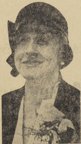
Mrs Ruth Bryan Owen, Förenta staternas minister i Köpenhamn.

President Roosevelt har bland andra uppseendeväckande nyheter kommit med en rad utnämningar av kvinnor till höga poster. Hans arbetsminister, myntverkschefen i Washington och Förenta Staternas nya minister i Köpenhamn äro kvinnor, Miss Frances Perkins, Mrs Nellie Tayloe Ross och Mrs Ruth Bryan Owen, samtliga kända som dugliga och framstående.