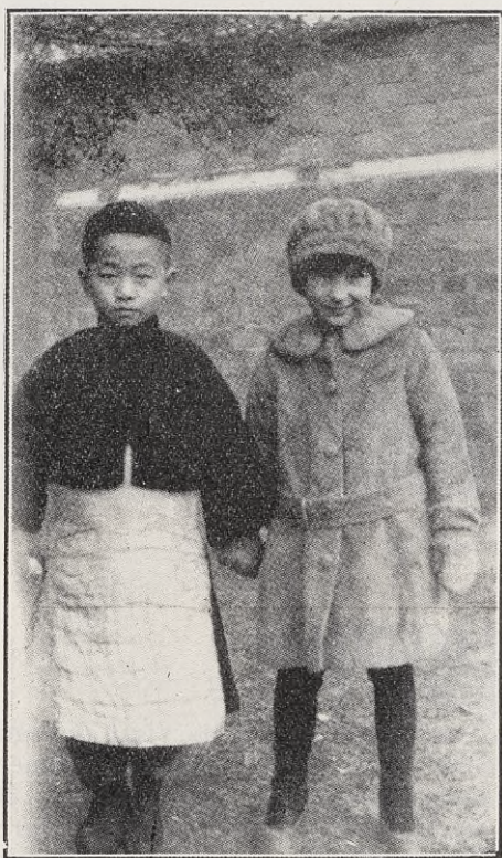
”Där Öster och Väster mötas.”