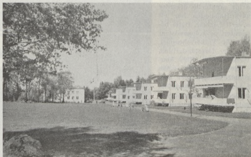
Vidkärrs barnhem i sommarsol