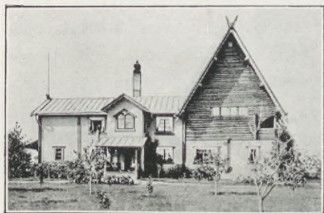
Artisten Zorns villa.

Med Mora är ett namn sammanknutet, vilket sedan flera år tillbaka burit stadgat världsrykte. Jag menar Zorns. Hans gård är belägen alldeles invid kyrkan, med en trädgård, som sträcker sig ut till landsvägen. Med platstidningens redaktör som ciceron hade jag nöjet få göra ett besök därstädes. Gården är byggd i gammaldags dalastil. Redan det yttre vittnar om, att vi befinna oss i ett konstnärshem och därtill ett sådant, som från början till slut bär en kulturhistorisk prägel. Den öppna, gammaldags spiseln i dagligstugan, de med skinddynor beklädda, väggfasta bänkarna, det grova, omålade träbordet samt mycket, mycket annat, som här finnes, bär nogsamnt vittnesbörd härom. I korridoren, som löper längs ena långväggen