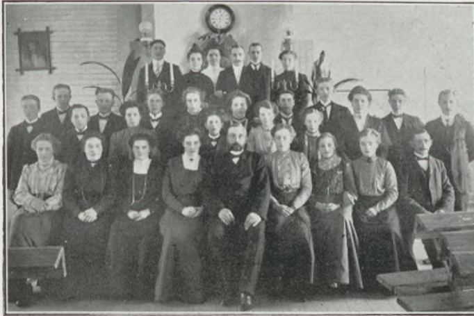
Tystberga Kristna Ungdomsförening.