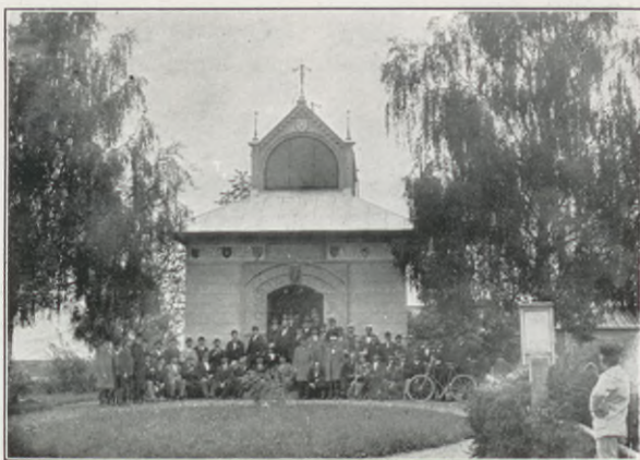
Vasamonumentet, vid Utmeland.

På ena väggen hänger Höckerts bekanta tavla »Gustav och Margit», å den andra en sådan av konung Karl XV med utsikt över Sälens by samt å den tredje väggen Edvard Bergs vackra tavla över Ornäs och Ornässtugan.