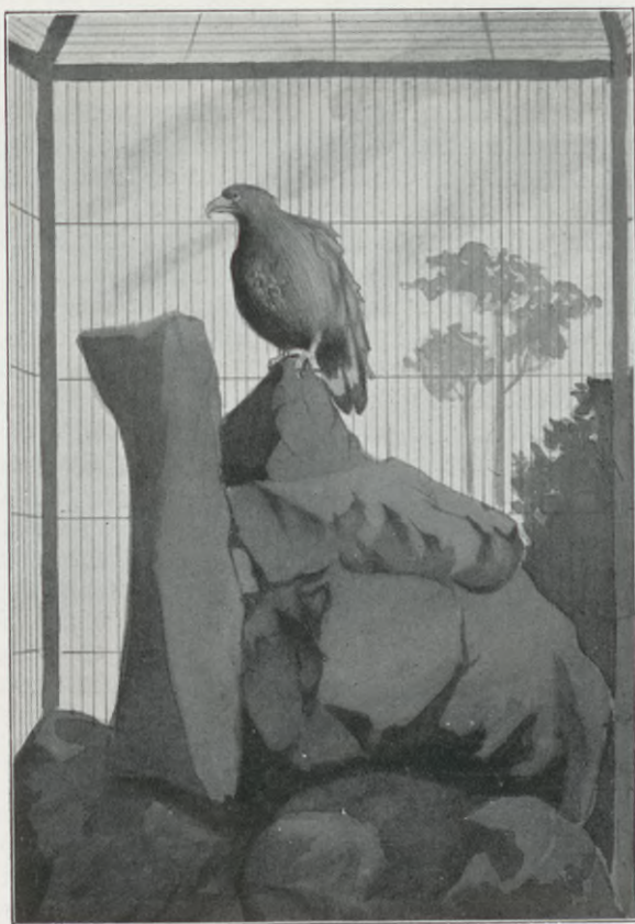
Örn i fångenskap.

Ju närmare vi komma Gud, desto mera kraft skola vi få till att göra hans vilja.