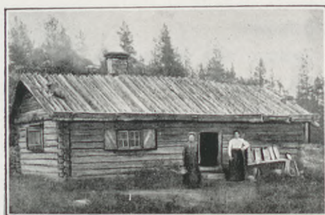
Fäbodstuga i Kväksel, Orsa.