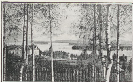
Parti av Siljan vid Mora.