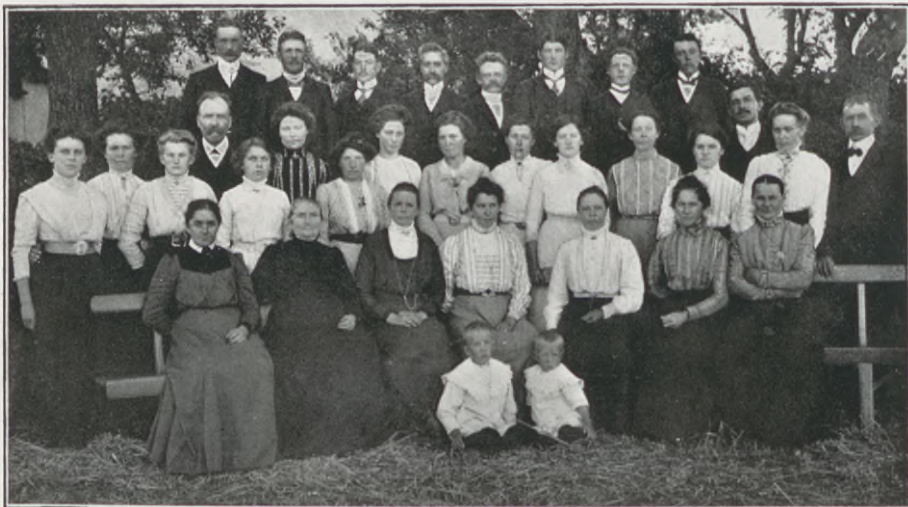
Gislövs och Gylle Ungdomsförening.