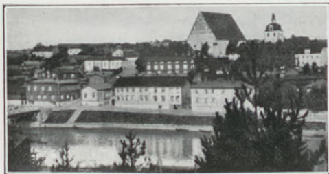
Vy från Borgå.