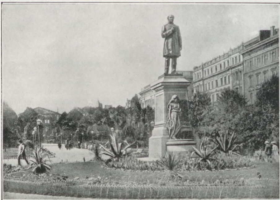
Runebergs staty, Helsingfors.

staty av skalden Runeberg. Och här rör sig ett livligt folkliv, som är ganska intressant att betrakta. Man ser här om varandra i brokigt virrvarr ryska militärer i granna uniformer, ryska soldater i höga stövlar och gula linneblusar med skärp om livet, ryska präster med långt hår och skägg, finska bönder i vadmalskläder o. s. v.