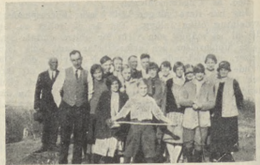
En grupp av ungdomsföreningens medlemmar.