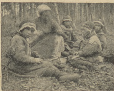
Undervisning i kvinnlig slöjd.

lappfar sträcker lättjefullt ut sig på granriset, och någon gång emellanåt gör unga fröken därborta i hörnet ett klipp i skinnlappen. Med tiden torde det bli ett par skor. Brådska är i det hela taget något främmande för kåtornas folk. Den oroliga, jäktande ande, som i stort behärskar nutidsmänniskan i det moderna samhället, har ännu icke fått någon makt med detta folk. Förutsättningarna för att den någonsin skall lyckas, så länge oblandat lapskt blod flyter i folkets ådror, äro för övrigt mycket små. I folkets inre, där böjelsen för mystik och meditation har djupa rötter, möter det största hindret. De ändlösa vidderna och det stora lugnet däruppe på fjäll