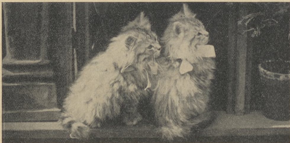
En vacker bild.

Många fingo hjälp därigenom, ty somliga jular lyckades insamlingen särdeles väl. Bland dem som fingo särskild hjälp, voro de fattiga barnen i Wien, Österrikes huvud-