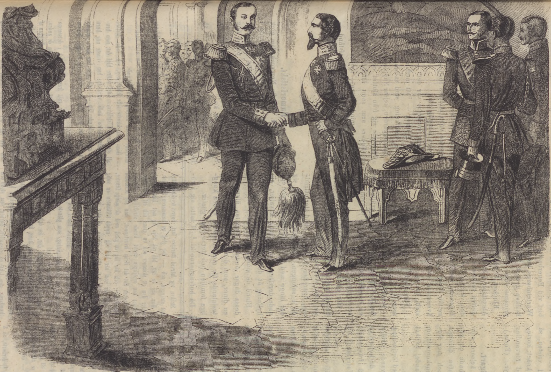
KEJSARMÖTET I STUTTGART