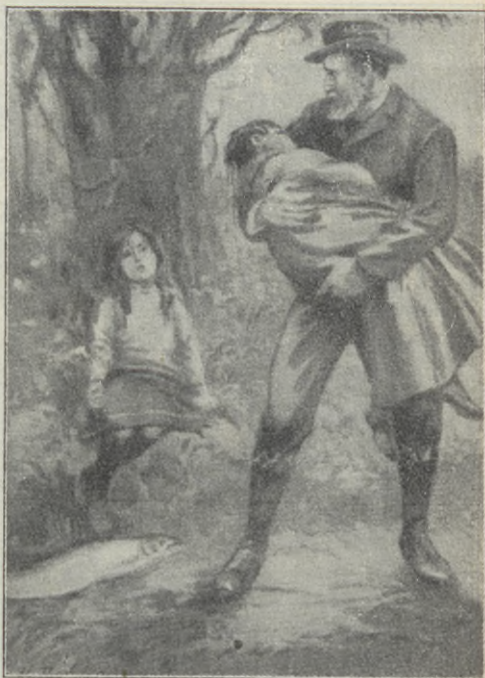
Fadern lyfte upp sin son.

Kära barn! — Det gives många vilsekomna och på syndens farliga vägar kringirrande människobarn i världen. Och — vår himmelske Fader sörjer däröver samt söker efter de förlorade. En hel här av tjänare har han sänt ut i det syftet. Dock — det är ej lätt att finna de vilselupna. I syn-