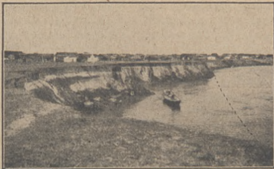
Området till vänster om den streckade linjen är den plats, som förut var påtänkt.

då gå till Shasi-Kingchow och upptaga arbetet där tillsammans med vår mission? När vi därför förliden höst skulle köpa tomt för det blivande