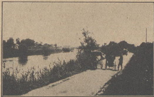
Kanalen och vägen mellan Shasi och Kingchow. Till höger om vägen ligger den köpta sjukhustomten.

vid Yangtsifloden; ja tomtens läge var utmärkt passande för ett sjukhus, nära till Shasi med dess 150,000 invånare och ej så långt från Kingchow heller (se kartan nästa sida), dessutom mycket nära floden, så att de sjuka lätt kunde kom-