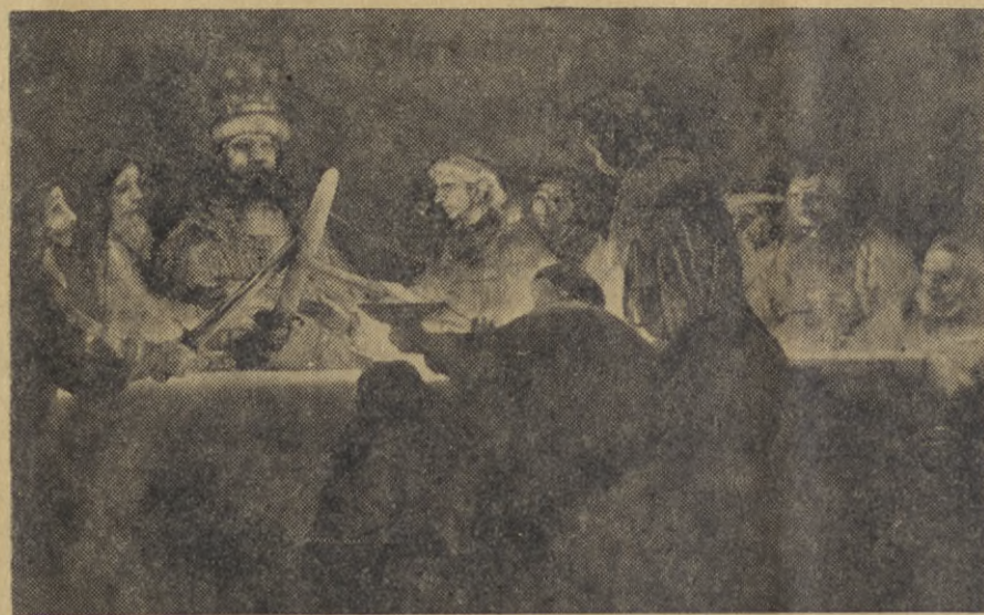
Rembrandt: Claudius Civilis sammansvärjning. Nationalmuseum, Stockholm.