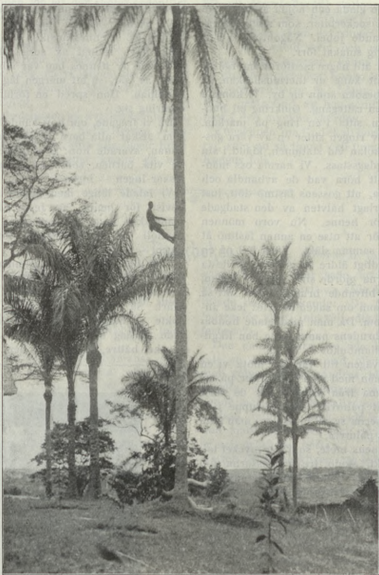
EN MAN, SOM TAPPAR PALMVIN.

Mest intresserade äro de av att höra något om våra små gossar, som några av dem sett vid ett besök på marknaden i Kingoyi.