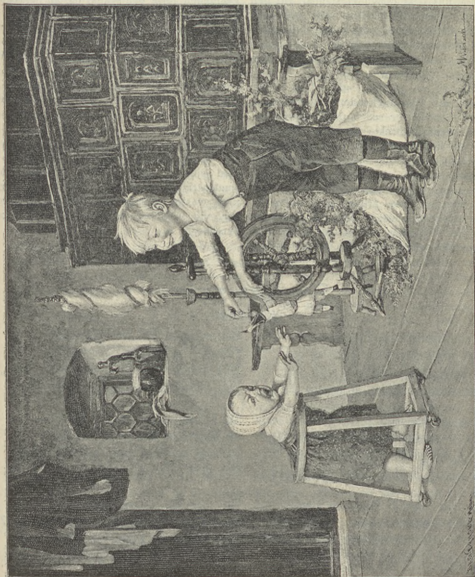
BROR OCH SYSTER.