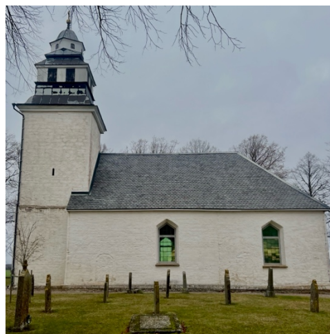
Fig. 11: Strå kyrka.

Under 1100-talet uppfördes Strå sockenkyrka i kalksten (Lindqvist 2004c:7f). Kyrkan bestod då av ett rektangulärt långhus samt ett smalare kor med absid. När kyrkans västtorn byggdes råder delade meningar om, om det byggdes samtidigt eller efter det att långhuset uppfördes. Runt senmedeltid eller eventuellt 1600-talet tillbyggdes en sakristia. Kyrkan byggdes även ut på 1640–1650-talen och 1771 skedde en ombyggnation av tornet som då fick sin nuvarande utformning,