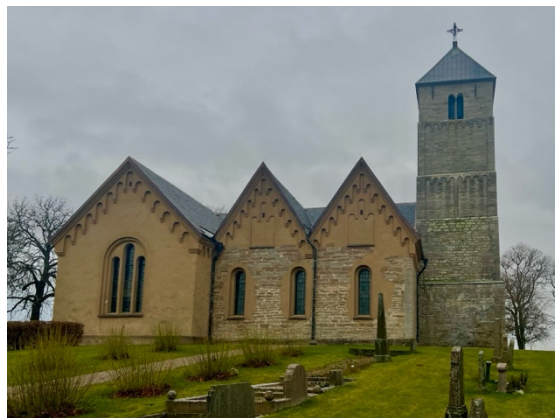
Fig. 3: Heda kyrka.

Heda socken är beläget i Lysings härad, sydväst om sjön Tåkern och sydöst om Omberg. Socken ligger i ett väl uppodlat slättlandskap, vilket tydligt syns på flygfoton och terrängskuggningen på Fornsök (u.å.). Enligt terrängskuggningen går det att se några få ställen som höjer sig något i landskapet. Bland annat Isberga naturreservat norr om sockenkyrkan, där det även finns flera gravar. Namnet Heda har anor från sent 1200-tal (Wahlberg 2003:121). Sockenkyrkan anlades vid sitt uppförande på hedmark i utkanten av en by och från 1294 finns det första belägget för kyrkans namn, som då var Hedeskyrke alltså 'kyrkan på Heden'. Namnet gick sedan över till Hedhe som kommer från fornsvenskans terrängbeteckning för hed.