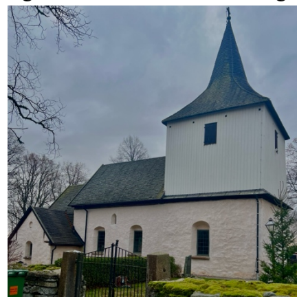
Fig. 15: Väversunda kyrka.

Enligt en dendrokronologisk datering är Väversunda kyrka byggd under 1160-talet e.Kr. (Lindqvist 2005e:7ff). Till en början bestod kyrkan av ett rektangulärt långhus med ett