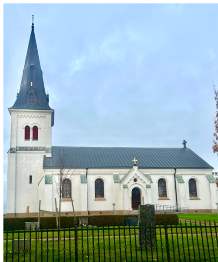
Fig. 2: Appuna kyrka.

Appuna socken ligger i Göstrings härad, väster om Tåkern. På flygfoton och kartan med terrängskuggningar på Fornsök över socknen går det att se ett platt odlingslandskap med ett fåtal områden med skog. Gårdarna är spridda i socknen, med en liten större koncentration hus runt sockenkyrkan, som är placerad i princip mitt i socknen. Sockennamnet Appuna är lånat från kyrkbyn, som på 1290-talet betecknades Apundhum (Wahlberg 2003:23). I Svenskt ortnamnslexikon (Wahlberg 2003) står inget mer om hur namnet har utvecklats, dock skriver Oscarsson et al. (1987:3) att under 1300-talet återfinns namnet som Appunda och Apondo . Från 1760 använder Carl Fredric Broocman beteckningen Apunda och skriver även att kyrkan tidigare benämns Abbotstuna eller Appeltuna . Beteckningen Apund är ett möjligt forntida namn som på fornsvenska kan översättas till 'den vattenrika; den flödande'.