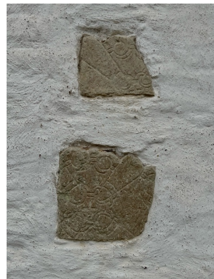
Fig. 16 & 17: de två inmurade runstenarna i Heda kyrka och de inmurade kalkstenshällsfragmenten i Hov kyrka.

Uppsatsen i sig fokuserar inte på runstenar, mer än som en fornlämning från yngre järnåldern, dock är inmurade runristningar i kyrkväggarna en intressant aspekt. Det är lite av en debatt gällande anledningen bakom det. Möjligtvis handlar det om en ideologisk bakgrund, där människorna ville flytta med sina förfäder till kyrkan (Gräslund & Lager 2012:635). Alternativt ansågs stenarna vara ett bra byggnadsmaterial. För uppsatsen är inmurade runstenar och kalkstenshällsfragment från tidigkristna gravmonument en intressant aspekt i frågan om huruvida övergången från fornnordisk religion till kristendom var en lugn och fredlig process eller mer kaotisk och motvillig. Detta går att koppla till det Hållans Stenholm (2012:39f) skriver om, att en elit som tar över en annan använder den tidigare elitens kulturarv för att visa maktbefogenhet. Alltså, kan ett alternativt perspektiv på inmurade runristningar som återbruk