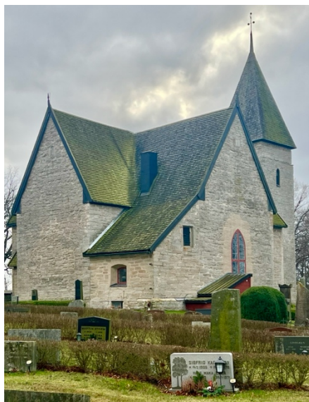
Fig. 9: Rogslösa kyrka.

Rogslösa socken ingår i Dals härad. Socknen är belägen nordväst om Tåkern och gränsar mot Vättern. Landskapet består främst av åkermark och är en del av Östgötaslätten. Det är en relativt platt terräng förutom kring de områden som gränsar mot Vättern, där höjer sig terrängen något. Den nordligaste delen av Omberg är en del av socknen, vilket skapar en kontrast till odlingslandskapet. Längs med Vätterns kust finns majoriteten av bebyggelsen i socknen, som tillsammans bildar småorten Borghamn. Det finns även ett par andra områden med en lite större koncentration av bebyggelse, som till exempel Rogslösa och Skedet, samtidigt som det finns flertalet gårdar utspridda i socknen. Sockennamnet Rogslösa kommer från kyrkbyn, som år 1286 har benämnts Rosløsum och 1363 som Rogsløse (Wahlberg 2003:257). Benämningen lösa har betydelsen 'glänta; äng'.