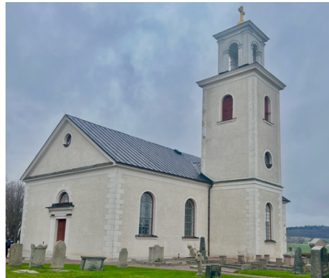
Fig. 14: Västra Tollstad kyrka.

Under 1100- eller 1200-talet uppfördes en kyrka i sten, som då bestod av ett rektangulärt långhus och ett smalare absidkor (Lindqvist 2004e:7f). Kyrktornet kan ha byggts samtidigt med långhuset eller en tid senare. 1783 gjordes en biskopsvisitation och kyrkan ansågs då vara i för dåligt skick och utdömdes. Församlingen försökte i det längsta behålla sin kyrka, men nybyggnadsplanerna drog ut på tiden. Ett förslag kom in om att uppföra en ny kyrka vid Alvastra klosterruin, men det avslogs 1827. I stället beslöts det att bygga den nya kyrkan på den gamla kyrkoplatsen. Efter församlingens önskans valde man att behålla den nedre delen av det medeltida tornet som sakristia.