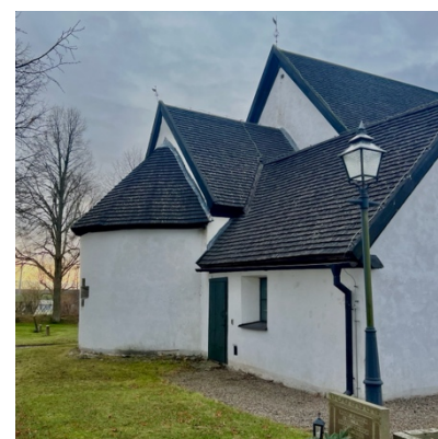
Fig. 6 & 7: Kumla kyrka.

En utgrävning gjordes 2020 i flera områden runt Kumla kyrka (Olofsson 2021). Ungefär 0,8 kilometer från kyrkan, i Åsby, togs ett markprov där en 14 C-datering av träkol daterats till mellan 668–862 e.Kr. (Olofsson 2021:9). De två runstenarna (L2011:3250 & L2011:3249) står intill varandra ungefär 1,3 kilometer från kyrkan samt intill dem en rest sten (L2011:2642). Likt