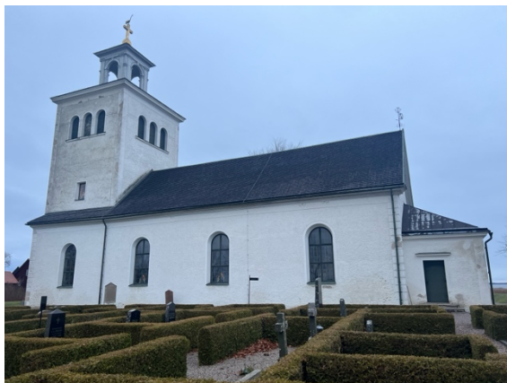
Fig. 13: Svanshals kyrka.

Den ursprungliga planformen av kyrkobyggnaden samt dess medeltida byggnadshistoria är inte helt klarlagd (Lindqvist 2004d:6ff). Troligtvis byggdes kyrkan under äldre medeltid. Kyrktornet uppfördes antingen i samband med den ursprungliga anläggningen eller kort därefter, dess nedre delar är sannolikt bevarade. Längre in under medeltiden byggdes ett kor i samma bredd som långhuset och kyrkorummet valvslogs. Sakristian byggdes till under slutet av medeltiden eller under 1600-talet. Det nuvarande utseendet av kyrkan kommer efter omfattande ombyggnationer som ägde rum åren 1842–1845. Exteriören målades om på 1920-talet och den sista stora reoveringen skedde mellan 1951–1956, detta för att kyrkan skulle återfå sin 1600-talskaraktär.