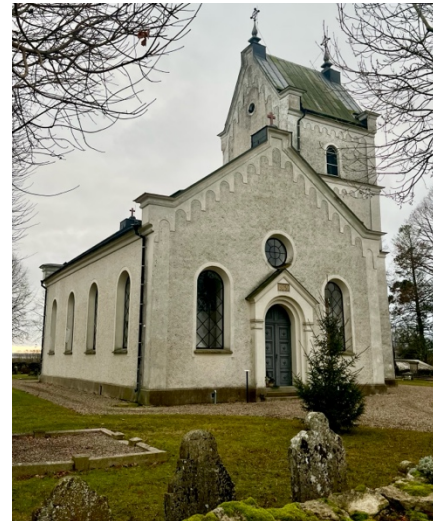
Fig. 8: Källstad kyrka.

Källstad kyrka byggdes under 1100-talet och bestod då av ett rektangulärt långhus, smalare absidkor och ett östtorn över långhuset (Lindqvist 2005b:7ff). Under 1860-talet skedde en stor ny- och ombyggnation av kyrkan. Det medeltida långhuset revs och ersattes av ett nytt intill östtornet, som stod kvar. Den sista renoveringen av kyrkan skedde i slutet av 1930-talet, då tre fönster murades igen och kyrkans inredning målades enhetligt om i en ljusgul färg. I samband med renoveringen talades det också om att renovera kyrkans fasad och att putsen på tornet skulle knackas ner. En åtgärd som sedan inte genomfördes.