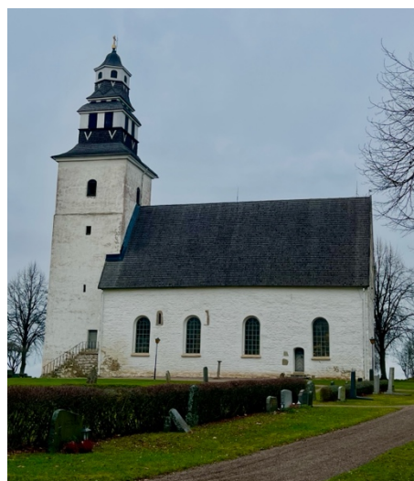
Fig. 5: Hov kyrka.

Den första stenkyrkan uppfördes under slutet av 1100-talets första hälft och utgjordes då av ett rektangulärt långhus och ett smalare, rakslutet kor (Lindqvist 2004:7f). Denna kyrka revs av okänd anledning, men på ungefär samma plats byggdes någon gång i slutet av 1100-talet eller under 1200-talet den nuvarande kyrkan, där delar av det gamla murverket användes för nybygget. När kyrkan under 1960-talet skulle renoveras framkom den äldre stenkyrkans grundplan. Kyrkans torn har genom dendrokronologi kunnat dateras till senare delen av 1400-talet. Hovs sockenkyrka har genomgått flera ombyggnationer, renoveringar och även någon rivning från 1100-talet fram tills idag (Lindqvist 2004:12–15).