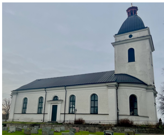
Fig. 13: Väderstad kyrka.

Fram till 1820-talet var dagens Väderstads socken uppdelad i två; Väderstads och Harstads socken (Lindqvist 2005d:7). Väderstads medeltida kyrka låg ungefär 0,6 kilometer sydost från den nuvarande kyrkan och var byggd i kalksten. Den bestod av ett rektangulärt långhus med smalare