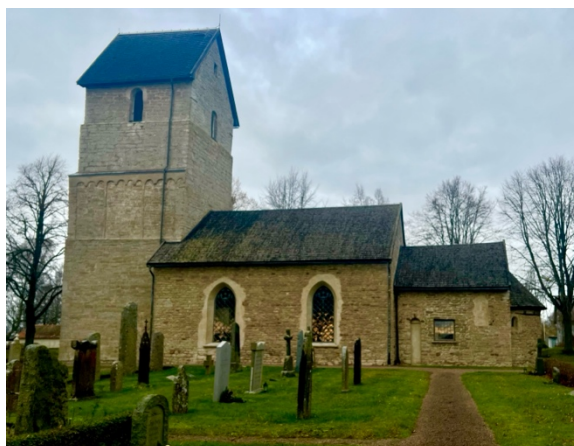
Fig. 4: Herrestad kyrka (fotografi av författaren).

Sockenkyrkan är belägen strax söder om mitten av socknen och har flera hushåll vid sig. Herrestads kyrka har daterats till 1112 ± 5 e.Kr., detta genom en dendrokronologisk datering av takstolen (Lindqvist 2005a:7f). Till en början utgjordes kyrkan av ett långhus och absidförsett kor. Sedan under 1100-talets andra hälft byggdes tornet. Kyrkan har fram tills början av 2000-talet genomgått flera ombyggnationer, renoveringar och restaureringar (Lindqvist 2005a:15–18). De runristningar som hittats är fragment av tidigkristna gravmonument. Monumenten består av fem hällar som har vikingatid ornamentik.