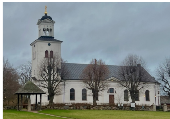
Fig. 10: Röks kyrka, med Rökstenen vänster om kyrkan.

Röks socken tillhör Lysings härad och är belägen söder om Tåkern. Socken är en del av övergångsbygden mellan Östgötaslätten och det småländska höglandet. Den nordligaste delen av socknen är ett relativt platt odlingslandskap, men den dominerande terrängen är en något ojämn skogsmark. Gårdarna är utspridda med en högre koncentration i socknens norra del, där även sockenkyrkan står. Röks kyrka och socken har troligtvis fått sitt namn efter Rökstenen som är belägen intill kyrkan (Wahlberg 2003:265). Rök är ett dialektord för 'toppig föremål, stapel' och Röks kyrka benämns år 1282 som Røskyrce .