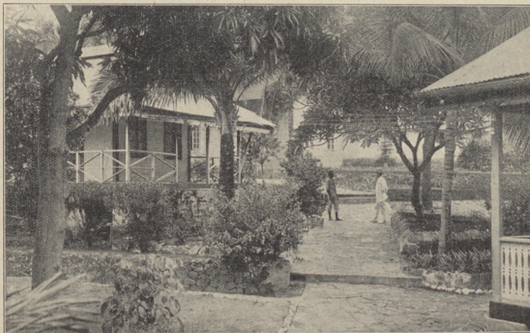
Vår transportstation Londe i Kongo.