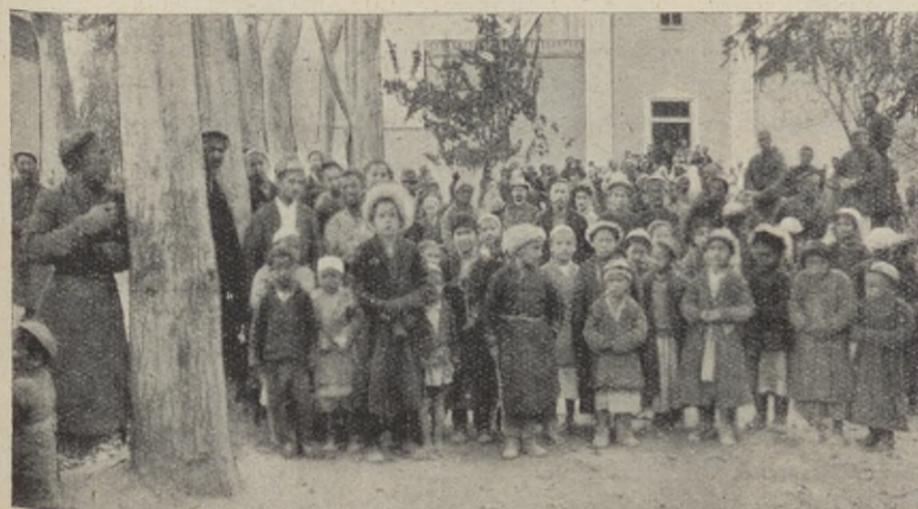
Från invigningen av kyrkan i Jarkend.

Ni ha kommit i dag till detta vårt första möte i detta hus. Nu skolen I också komma ihåg, att varje söndag hålles predikan här. Men läggen på hjärtat, att vi icke samlas till någon teater eller dyl kt. Här skall vara ett heligt rum, där vi alltid med vördnad och still-