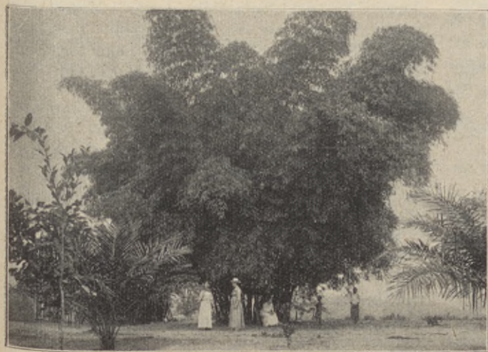
Bambuske vid Madzia.