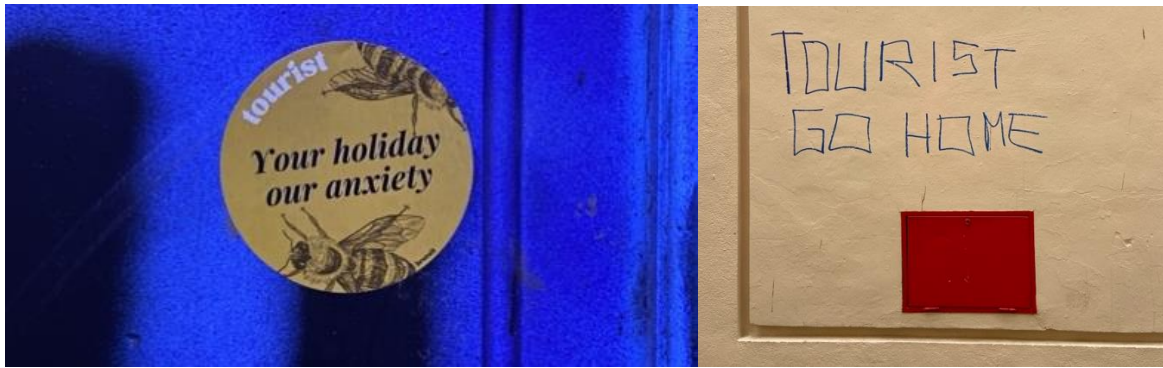
Figur 1: Klistermärke uppsatt på skylt (vänster), anti-turismgraffiti på husvägg (höger)