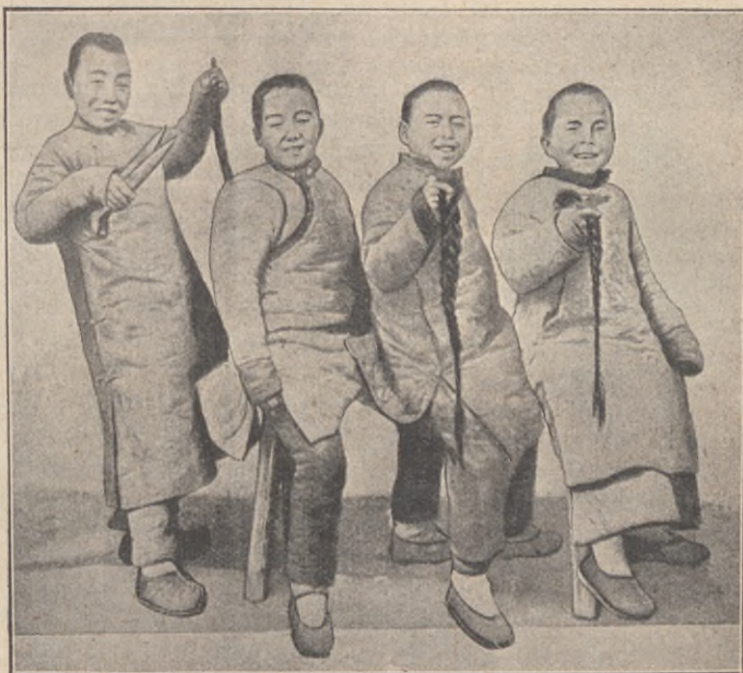
När hårpiskorna klippas av.

Förhållandena i Kina synas utveckla sig med en otrolig fart. Visserligen är ju icke det väldiga landet reformerat i ett nu, och än dröjer det länge, innan alla de inre delarne nåtts av de moderna tänkesätten. Den nya regeringen har sig oerhörda uppgifter förelagda, ett jättearbete utan like. Emellertid tycks det, som om de konservativa kineserna ej skulle finna det så synnerligen svårt att offra det ena efter det andra av sådant, som i yttre avseende varit utmärkande för dem.