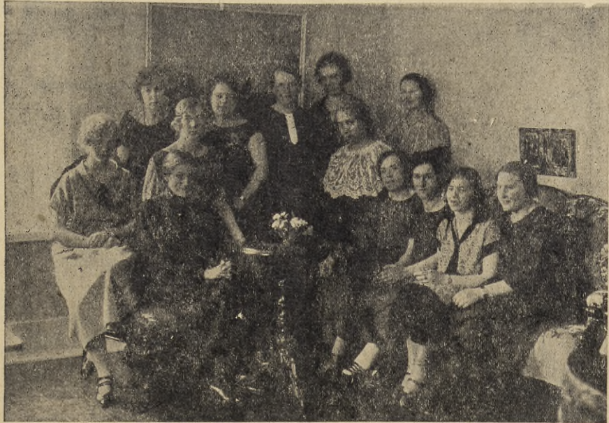
Skolans första kurs 1925.