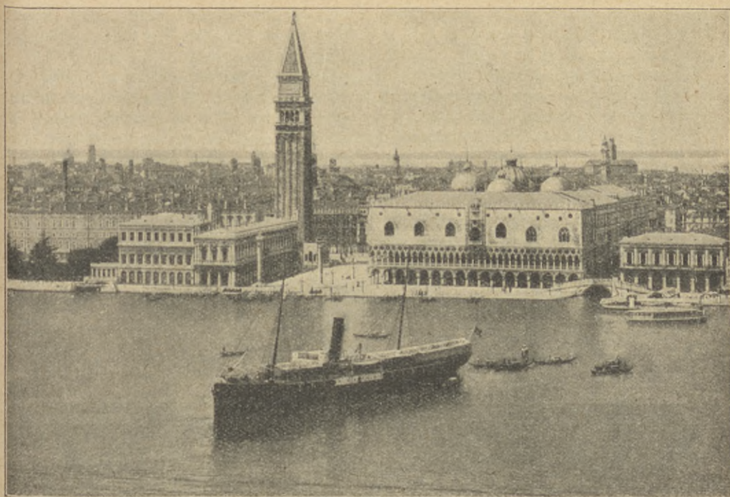
UTSIKT FRÅN VART FÖNSTER.

människor. De ropa och skrika och gestikulera ivrigt. Men var inte rädd, de äro inte osams! Sydländingarna äro bara så livliga jämförda med oss, nordbor. Vi blanda oss i vimlet och hålla ögon och öron öppna. Men vakta väl din portmonnä, för det kunde hända, att du bleve bestulen, innan du visste ordet av!