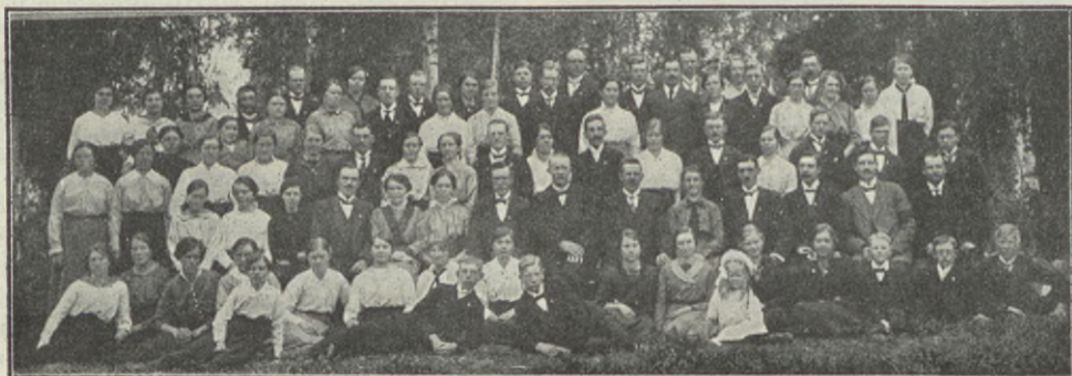
Alfta friförsamlings ungdomsförening.