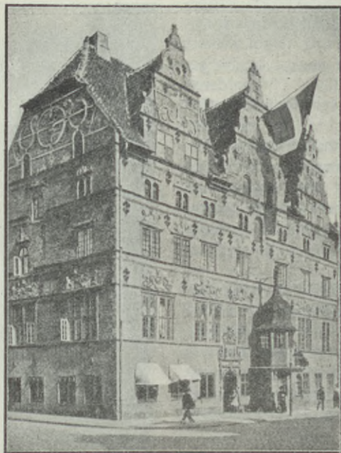
Jens Bangs stenhús, Aalborg.

Mitt uppehåll i Köpenhamn var bestämt till tre dagar. Det blev tre arbetsamma dagar men därför också intressanta. Om dagarna voro vi på språng ute i staden för att ta dess sevärdheter i betraktande, och på aftnarna hade vi möten i det lilla missionshuset, Tingvej 11.