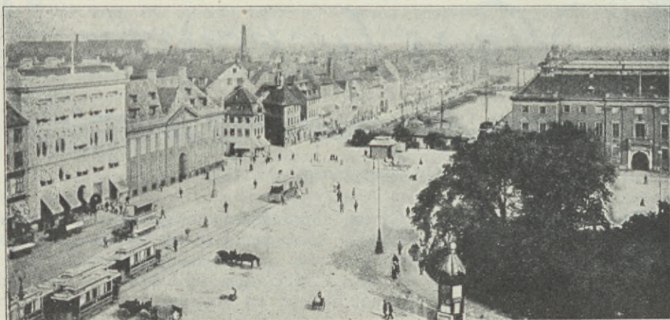
Vy från Köpenhamn. Nyhavn och en del av Kongens nytorv med Charlottenborg t. h.

Fortsättningen av min resa kan jag ej skildra så i detalj som vistelsen i huvudstaden. Från Köpenhamn gick färden till Hälsingör , där vi hade möte gemensamt med hälsingborgarna, som med sin sångkör och musikförening höjde stämningen. Från den lilla vackra staden vid Sundet gick så vår färd över Själland och Fyen till Jylland, där jag tillbragte sista veckan i Danmark. Resan är omväxlande, färningen över Stora och Lilla Bält av-