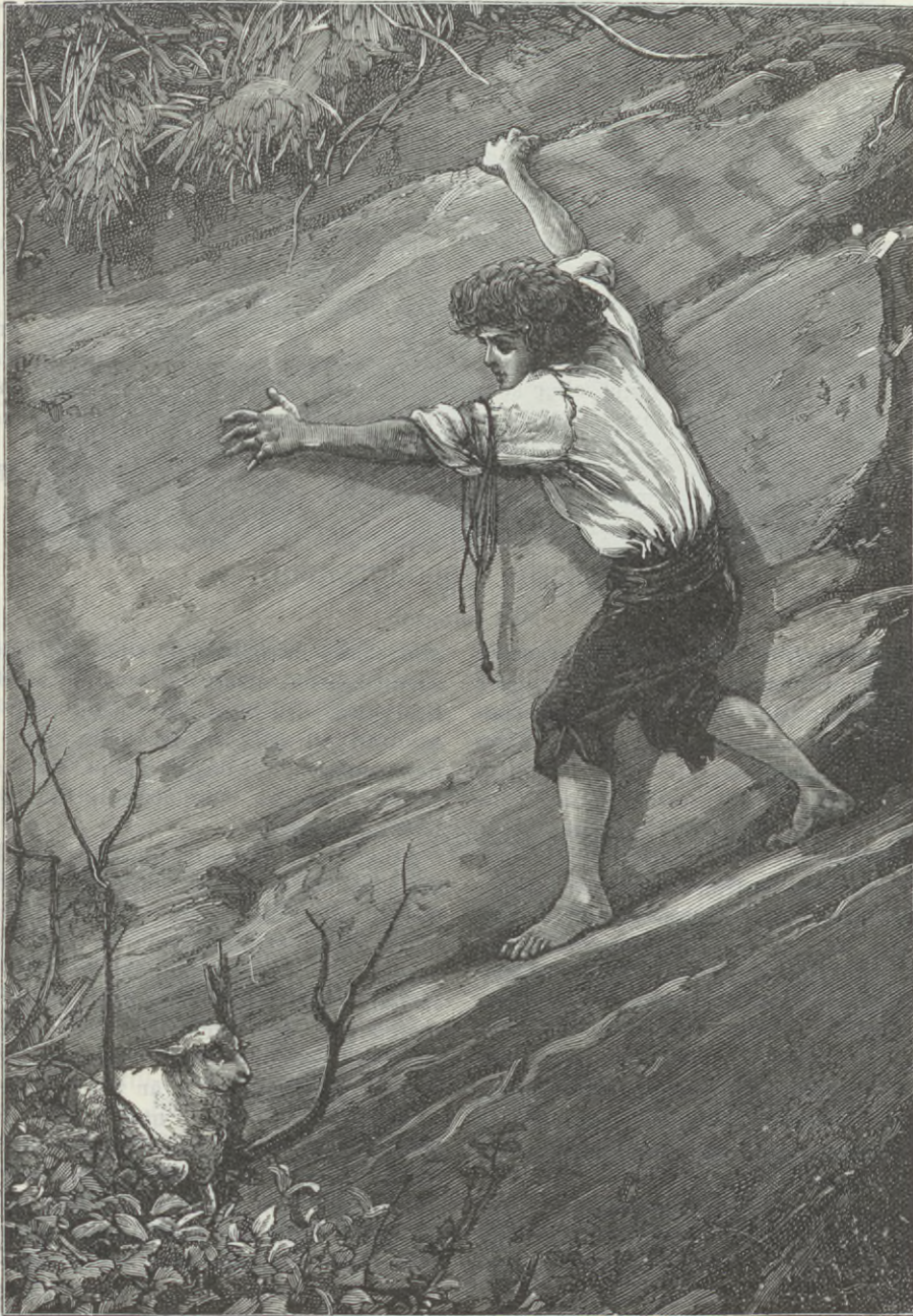
ETT BORTTAPPAT LAMM.