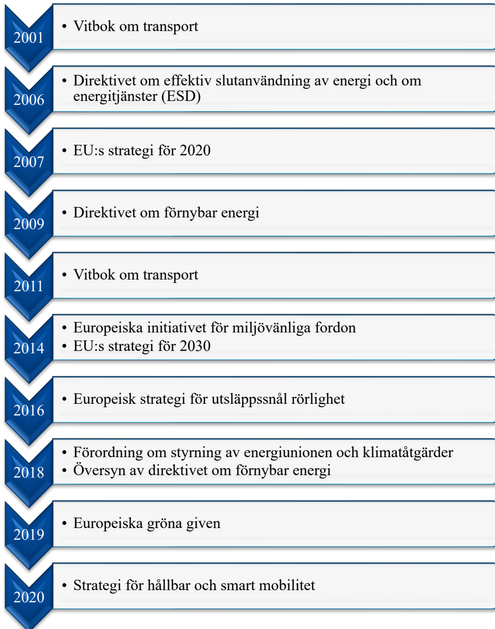
Figur 2: Fallande tidslinje över större transportpolitiska och miljöpolitiska händelser åren 2001-2020