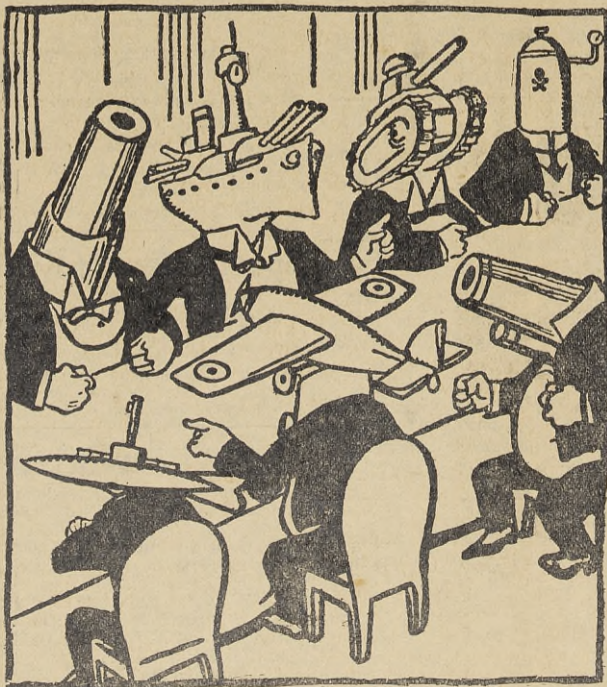
Den blodiga satiren: Nedrustningskonferensen samlas på nytt.