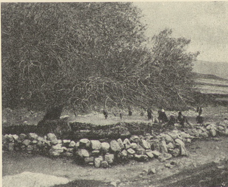
En helig terebint i det nutida Palestina.

önska vattna sina hjordar vid stadens källa. Man kan ej heller förvåna sig däröver. Det kan nämligen ofta hända, att en eller flera dylika hjordar helt och hållet kunna länsa den brunn, där de få hämta vatten. Staden vill därför ha sin källa i fred, och så var nog fallet även vad Sikem beträffar. En främ-