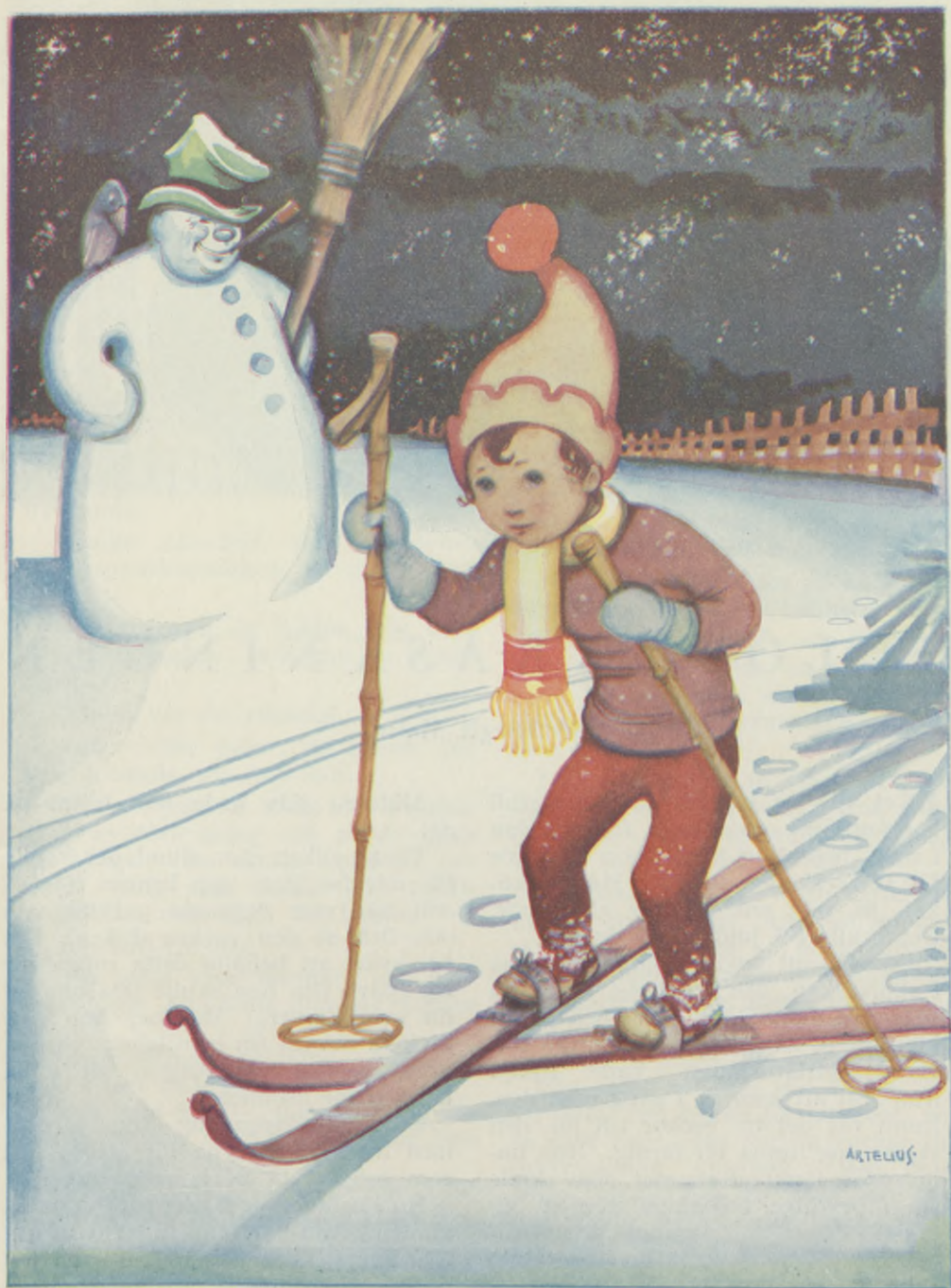
De första skidorna.