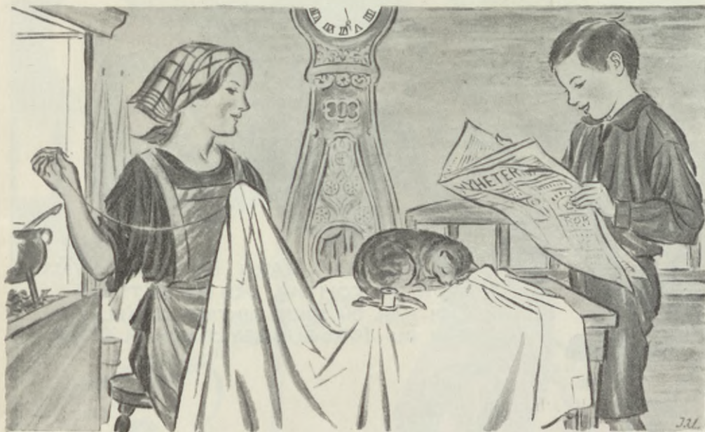
— Mor, den här platsen skall jag söka.

Sonen såg frågande på fadern. Denne fortsatte omedelbart: