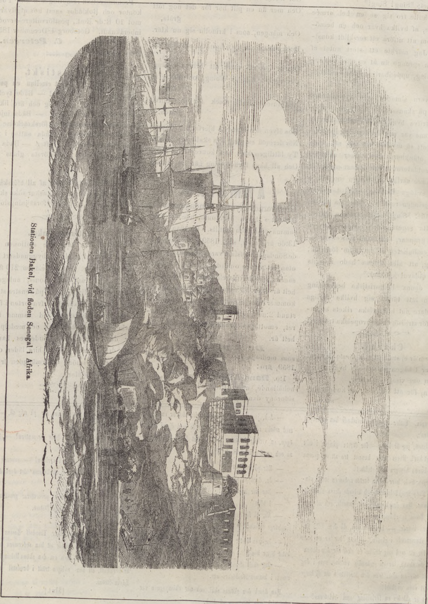
Stationen Hakel, vid Roden Senegal i Afrika.

Härmed följer Romanbihaget: "Gamla Elsa," pag. 9-16.