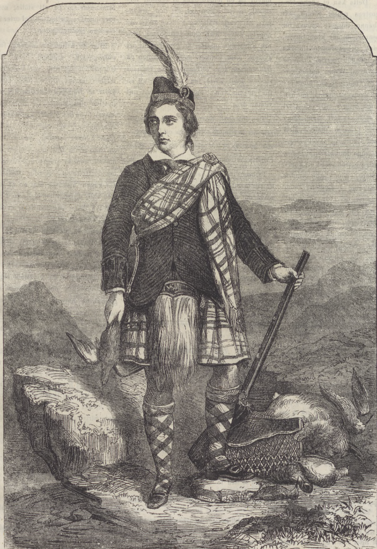
Prinsen af Wales.

N:o 51. Utkommer hvarje Söndag. Göteborg den 19 December 1858. Pris för år: 6 R:dr 32 sk. B:co. XII årgången