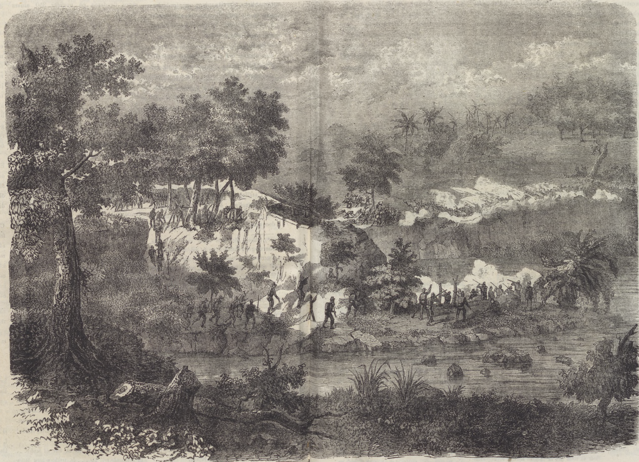
Expedition af Holländarne emot trupper på ön Sumatra.