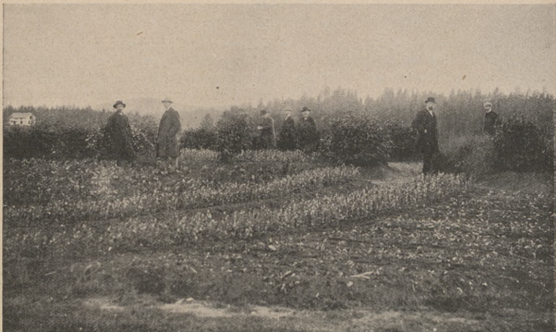
Anläggning av skogstorp.

Genom statens bemedling äro på flera ställen stora s. k. kolonat, d. v. s. krononybyggen på kronans mark, anlagda. Och flera skola anläggas. Dessutom har intresset för nyodlingar och utvidgningar i senare tid tilltagit i avsevärd grad även å jordbrukarnas hemman.