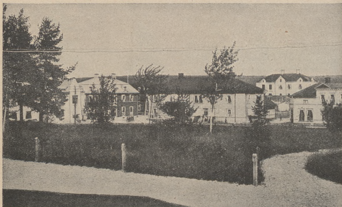
Från Lycksele kyrkoby.