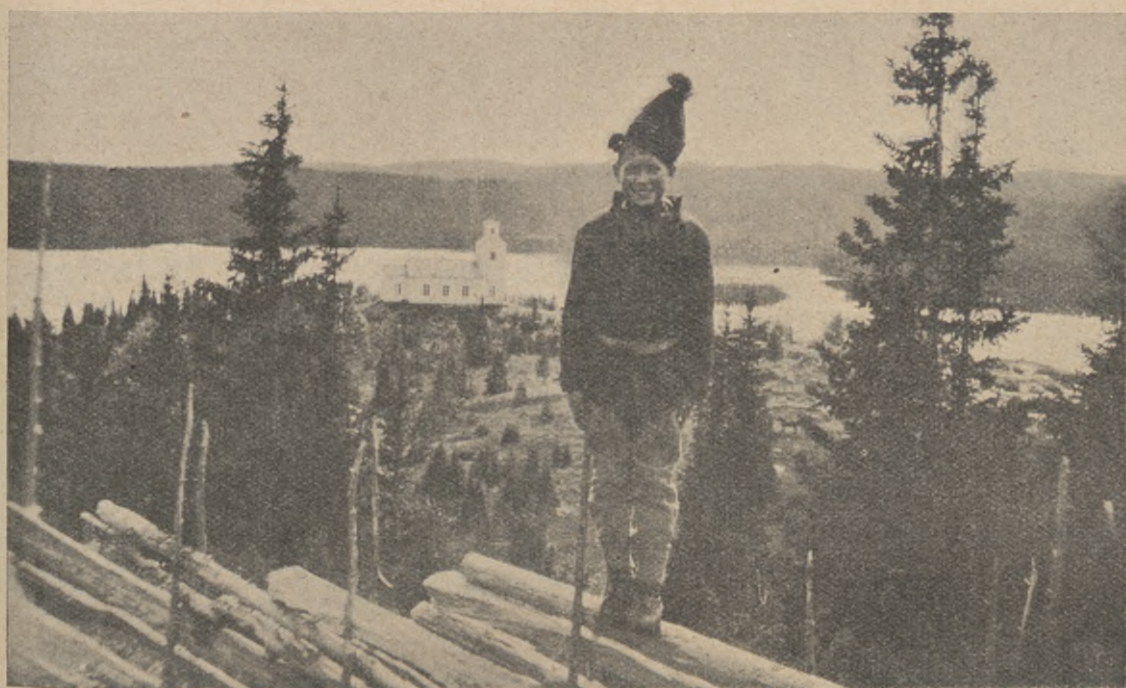
Det unga Lappland.

Man har gjort den iakttagelsen, att partissinnet uppenbarat sig fullt ut lika ofta hos kristna, som hava lätt för att byta om åsikter samt gått från det ena samfundet till det andra, som hos sådana, som troget stått kvar inom den grupp, dit de först anslöto sig, och där de fått sin andliga fostran, ehuru det förra vanligen räknats såsom varande ett större bevis på kristligt nit och sanningsintresse.