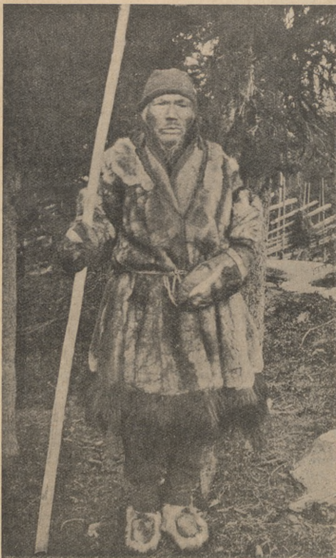
Det åldriga Lappland.

Då en Herrens apostels ämplar partisinnet som en kötets gärning, bör man bedja Gud om frälsning därifrån. Det finnes ingen kristen, som har rättighet att vara partisinnad, han må tillhöra vilken kristlig sammanslutning som helst. Men då det gäller denna sak, går det i allmänhet lättare att se andras fel än sina egna.