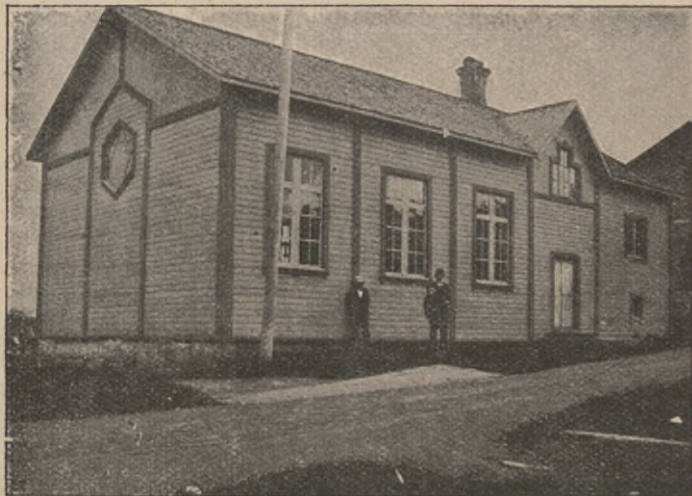
Missionshuset i Vilhelmina.

I Västerbottens Lappmark finnas nu åtta till Svenska Missionsförbundet anslutna församlingar, nämligen i Gunnarn, Lycksele, Malå, Sorsele, Stensele, Vargträsk, Vilhelmina och Åsele. Därjämte finnas fem ungdomsföreningar och nio söndagsskolor. Missionshusens antal är sju. Deras bokförda värde är omkring 75,000 kr. Ordinarie predikanter finnas likaså till ett antal av sju.