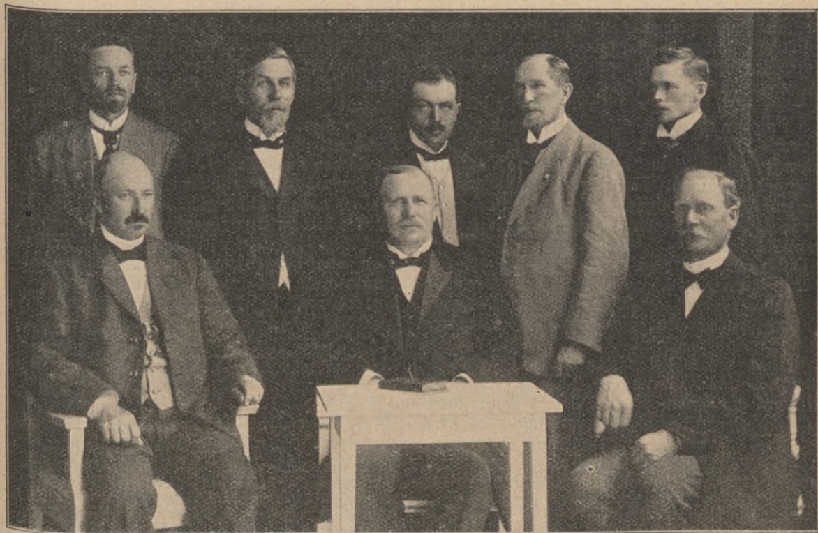
Från inspektionsresan i Lappland 1920.

Vad nu evangelistverksamheten i Lappland beträffar, så har den såsom överallt annorstädes visat sig vara till stor välsignelse. Men svårigheten har varit och är den, att fältet fått behålla bröderna så kort tid. De flesta ha för vidare utbildning sökt sig in vid missionskolan eller någon annan skola. Och då den varit genomgången, ha de i regel tagit plats i någon annan del av landet, varför Lappland sålunda förlorat dem för missionen.