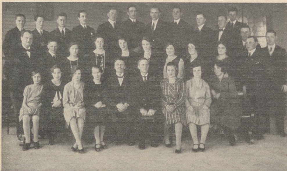
Östervåla missionsförsamlings sängkör.