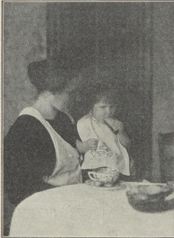
Lilla Ulla och hennes mamma.

kunde vi ej säga nej, och så fingo dessa mat och vård hos oss. Vi tycka oss se, hur förtjusta Ni skulle vara, om Ni hade fått se efter dessa små svarta gossar. Men då det nu är så