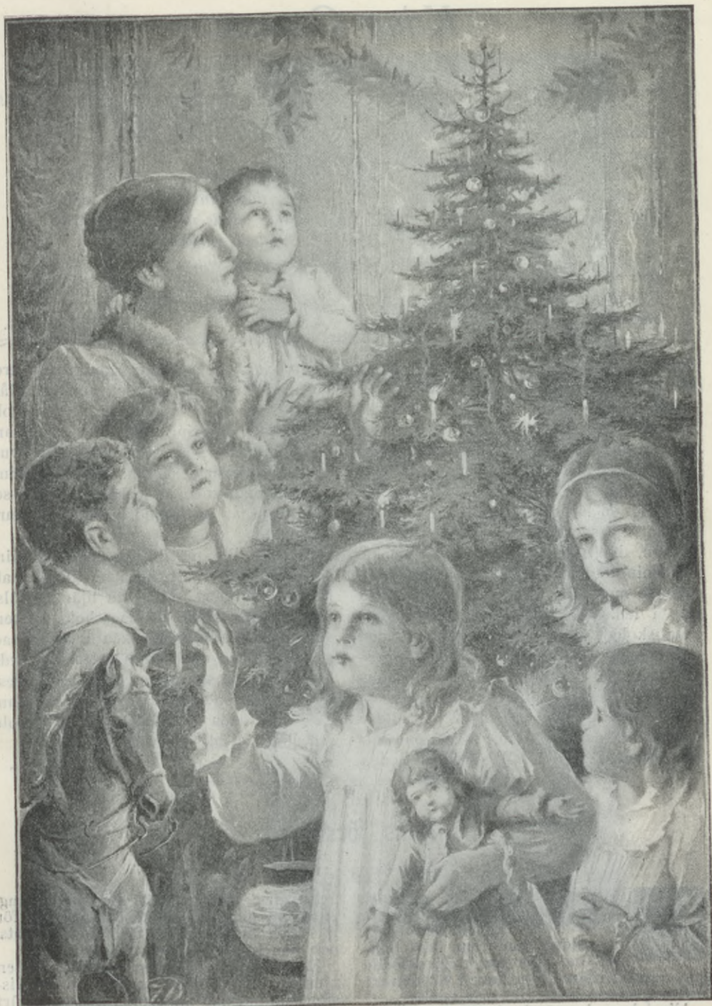
Alla i hans by vände sig till de stannade sig till och skivte. Under snöflöden ögsådana för att göra hjälp. KRING GRANEN.