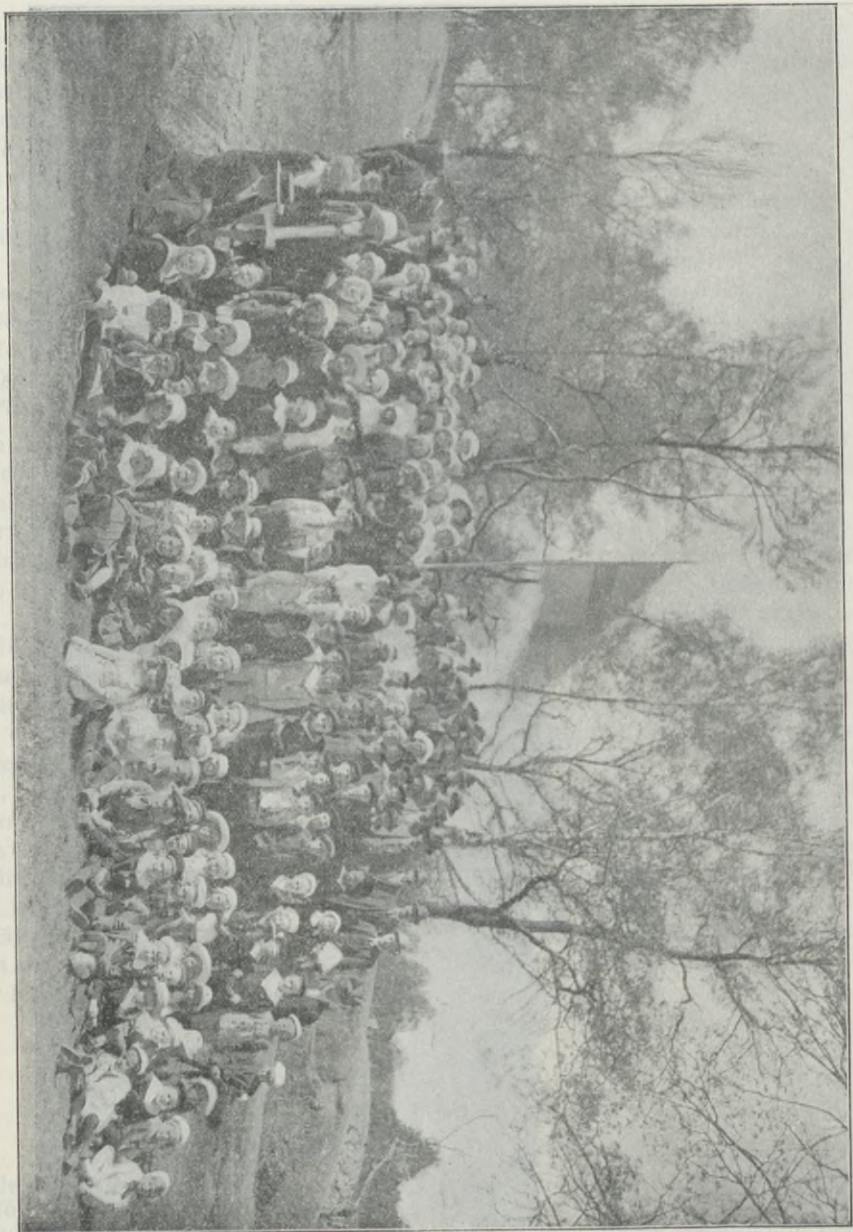
RÖRSTRANDS FÖRSAMLINGS SÖNDAGSSKOLA OMKRING SVERGES FANA.

En äldre brude som varit felis och Gud eller om hans enfödde som Jesus Kristus, som kom i världen att föreläsa om både vita och svarta. Alla i hans by vände sig till de stannas ordstämman för att söka hjälp. och han hade många skärlar. Efter det så var han arbetad på en påskdag hade han kommit till en mäs- sionsmission, där han såg många och lärt sig mycket och skönt. Under skönliten hade han såväl det som den stora