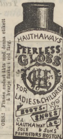
OBS! Finnes endast åkta med denna etikett & hvarje flaska i röd färg.

LAMPOR, Det nyaste, finaste och billigaste för säsongen.