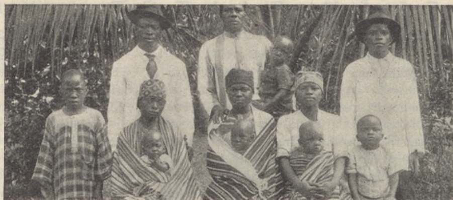
Tre lärrefamiljer från samma by i Kongo.

Juldagen döptes och intogos i församlingen 268 personer. En härlig skörd för Guds rike, eller hur? Hela församlingens medlemsantal uppgår nu till 936. Det är ej ett lätt arbete att hålla reda på dem alla och bistå dem med råd och hjälp i både det som är möjligt och omöjligt samt se till, att de få den andliga vård, som är nödvändig för deras tillväxt i tro och rättfärdighet. Vi bliva ofta missmodiga inför vår vanmakt. Dock har Gud intill denna stund hjälpt, och våra missionsvänners förböner ha skingrat