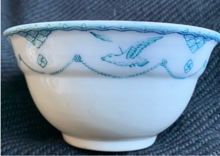
Skålen Öresund. Formgivare Nic Hyllestad, Gustavsbergs porslinsfabrik.

globaliseringen och konsumtionssamhällets framväxt. Introduktionen av porslin i hushållen kan också kopplas till frågor om status, iögonenfallande och avgränsande konsumtion, så som den tolkats av Veblen (1899/2007) och Bourdieu (1979/2010). Nya vanor och umgängesformer växte fram där det nya moderna porslinet, tillsammans med kaffe eller te, ingick i rekvisitan: Frukost med varm dryck, kafferep och eftermiddagste (Smith 2002:183–187; Berg 2005:228–230). I Sverige minskade också brännvinskonsumtionen i takt med att kaffedrickandet etablerades (Ahlberger & Mörner 1993:101).