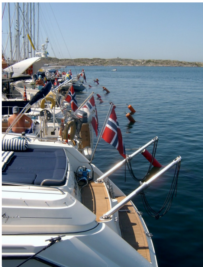
Ett stort antal norska turistbåtar i Kärings hamn 2005.

vice, så som affär, skola och buss- och båtförbindelser, är det viktigt att husen är bebodda under en stor del av året och inte bara under den korta sommarperioden. I detta avseende har norrmännen från Osloregionen en fördel genom kortare avstånd till fritidsorten jämfört med fritidshusägare från östra Sverige. Kommunalrådet i Strömstad uppgav i en tidningsintervju 1998: ”Vi ser det snarast så att det är en fördel att norrmän från Fredrikstad, Sarps-