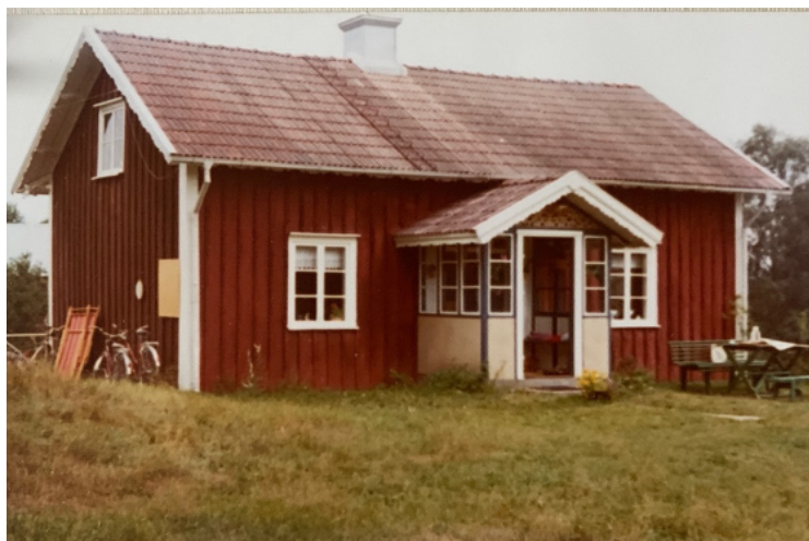
Torpet Skalleved tidigt 1970-tal.

damppartiklar dansar i ljuskäglan. På golvet väskor och lådor med gamla grejer. Ett par kryckor av trä som tillhört Viktor som en gång ägt torpet. Och där ser jag skålen tydligt framför mig, bland saker i en brun kartong. Jag tror mig veta säkert att det är här på denna specifika plats som jag upptäcker den lilla vitgråaktiga porslinskålen, med blågrön dekor föreställande flygande fiskmåsar.