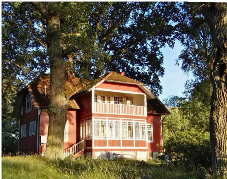
Ekudden från sjösidan, juli 2017.

Den ursprungliga trädgården var till för både nytta och nöje. Här fanns fruktträdgård, vinbärslister, köksträdgård, potatisland, men också rosenrabatter, ringblommor, krasse och perenna växter. Under första världskriget höll man sig med en ko, som fick stå för mjölkförsörjningen. Lille Gösta var då inte så gammal och tillgång till mjölkprodukter var ett privilegium i ransoningstider. På 1930-talet anlades ett stenparti och trädgårdsgångarna var täckta av grus. Det var ett evigt sjå att hålla dem ogräsfria – ofta en (föga populär) uppgift för barnen.