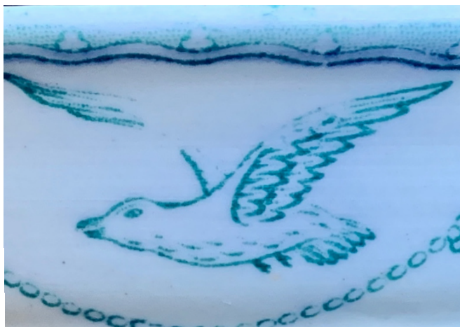
Skålen Öresund. Detalj av måsen.

slappt hängande fransar i nedre högra hörnet av figuren. Två korta ben sticker ut under fågelns buk, snett vinklade mot höger. Hela fågelns nederdel är dekorerad med små korta, lite böjda streck som markerar fjäderdräkt. Måsens öga är mandelformat och ett svagt streck ovanför får mig att associera till ögonbryn. Näbben består av två relativt tjocka parallella streck som pekar mot vänster, svagt nedåt. I kombination med det spetsiga ögat ger det ett litet komiskt intryck, som om ansiktet hade mänskliga drag.