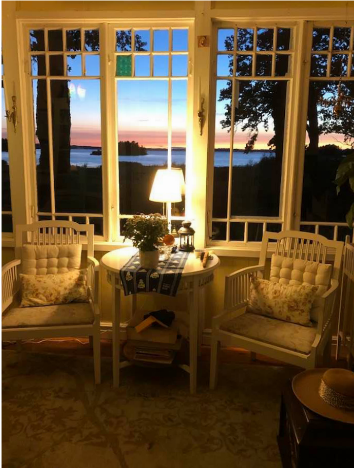
Glasverandan i solnedgången, augusti 2020.

Nog kan man säga att hela jag, Ekudden, utgör ett slags minnesreservoar. Väggar, trappor, fönsterkarmar och dörrfoder, ja, allt vittnar om vad som varit och vad som senare skett här i huset. Likadant är det med tingen som finns kvar. De väcker minnen till liv – och berättelser, så även för mig. Rodret till Kalle Södergrens