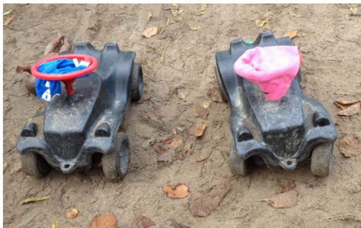
Mössor avtagna under lek.

främst som repressiv, utan makten är produktiv (Foucault 1980). Makten kan resultera även i erbjudanden om sådana relationer och subjektspositioner som kan ses som positiva, samtidigt som de leder subjektet att agera på sätt som följer normerna.