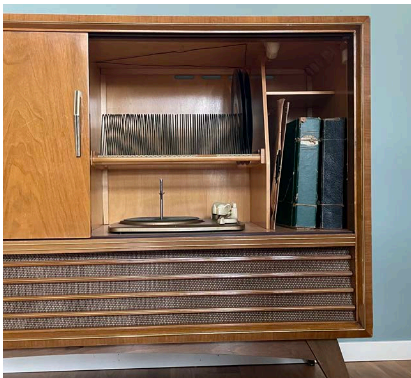
I den högra delen finns förutom skivspelaren också plats för skivor.

”Tutti Frutti” med Pat Bone och ”I was the one”, ”Heart break hotel”, ”Jailhouse rock” samt ”Love me tender” med Elvis Presley. Som Inger minns det tillhörde skivorna i första hand de vuxna. Det bekräftas också av att någon skrivit: ”mammans och pappas EP-skivor” på insidan av häftet. Men det fanns samtidigt skivor som Inger betraktade som sina egna: