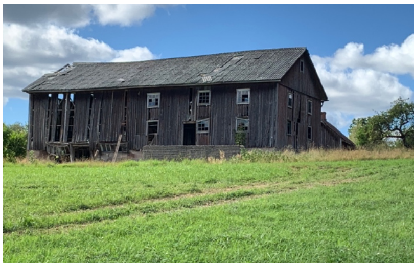
Granngårdens ladugård står förfallen.