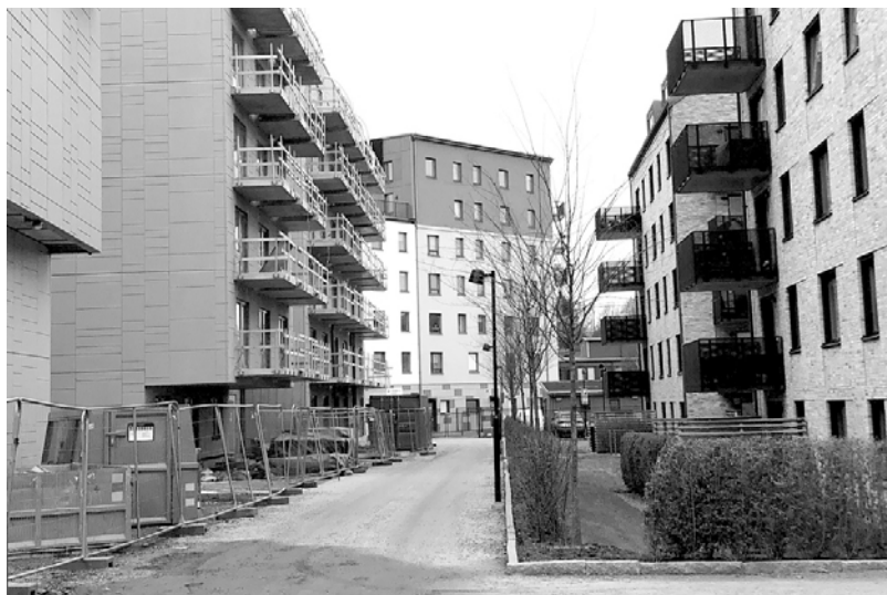
Famngatan 2022.