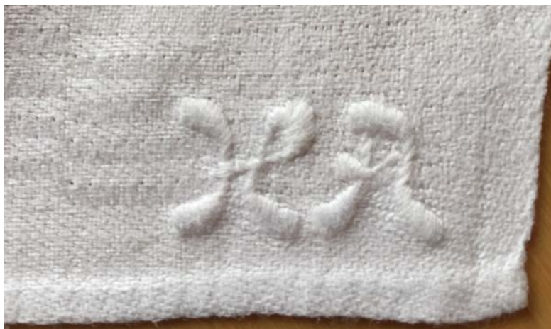
”HA” – broderat monogram.

på brudlinnet sedan fästmannen hade stupat i första världskriget (Meurling 2017).