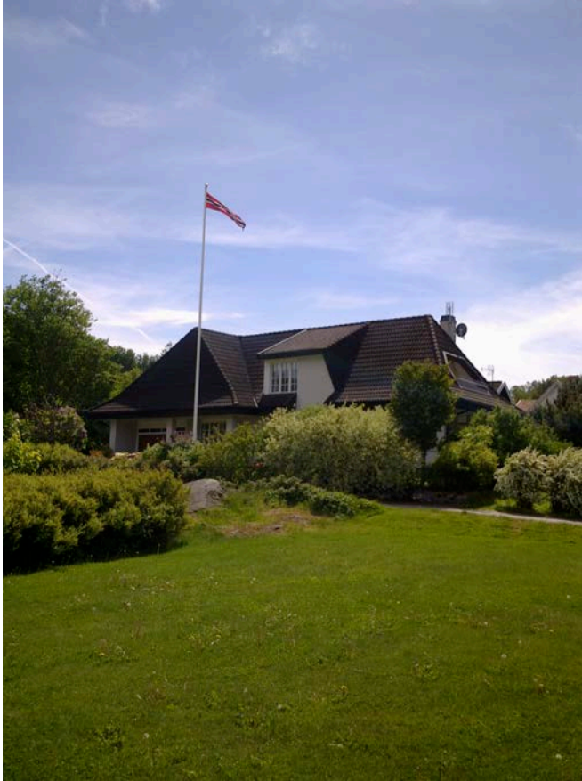
En norsk vimpel vajar utanför ett norskägt sommarhus i kustorten Ellös i Bohuslän 2011.

borg eller Oslo köper fastigheter i stället för att stockholmare eller göteborgare gör det” ( Göteborgs-Posten den 12 januari 1998). Norrmännen har medvetet vinnlagt sig om att bli integrerade bland ortsborna. De har varit försiktiga med att hissa den norska flaggan för att inte väcka anstöt. Däremot anses det vara i sin ordning med en norsk vimpel utanför huset, vilket jag iakttog första gången 2011.