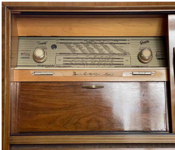
Till vänster bakom skjutdörrarna finns radioapparaten.

I en bok baserad på självbiografiska berättelser av människor födda mellan 1916 och 1942 beskriver Kerstin Gunnemark (2006:12) 1950-talet som en utpräglad brytningstid med tanke på hur ”moderniteten gjorde sitt intåg i många svenska hem”. Men även om vardagen till följd av det kom att förändras för de allra flesta, var moderniteten samtidigt inte lika given för alla och överallt. Snarare, hävdar Gunnemark, bör 50-talet också förstås som ett decennium fyllt av paradoxer. Ofta är det dock föränd-