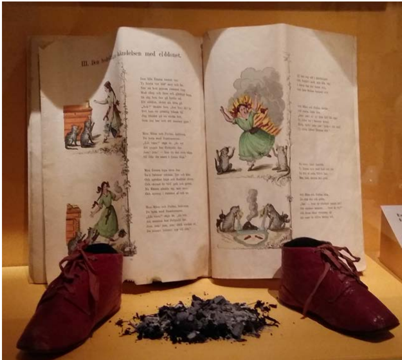
Emmas aska och skor på Nordiska museet.

rättade om de specifika nordiska ljusförhållandena och beskrev hur den tekniska utvecklingen kring belysning har påverkat människors liv.