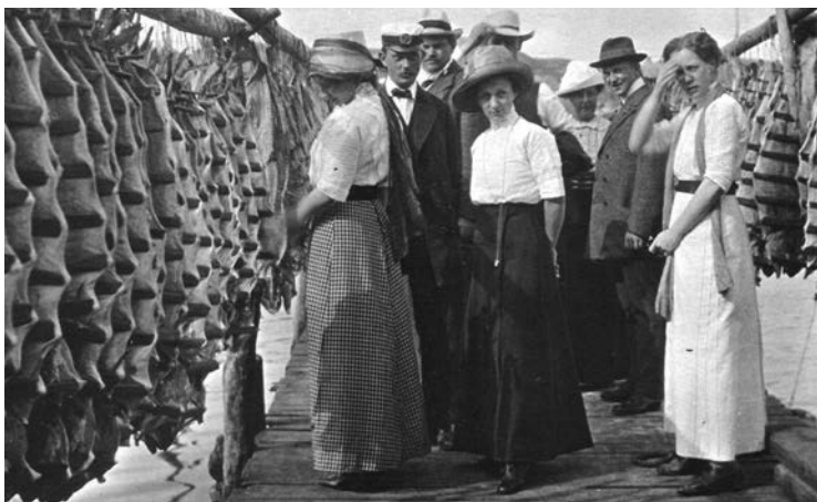
Vitklädda sommargäster vandrar runt och betraktar spillångaberedningen i Mollösund i början av 1900-talet.

En undersökning som jag utförde med Gunnemark som fält-assistent under tidigt 1980-tal gällde det bohuslänska fiskeläget Åstol nära Marstrand. Där fanns vid den tiden en stark pingströrelse och få sommargäster som ägde hus, trots att det tidigare dominerande fisket till stor del hade upphört under 1960-talet (Gustavsson 1984). På Åstol fanns endast omkring tjugo procent sommargästägda hus i början av 1980-talet. Två pingstvänfamiljer blev de första sommarhusägarna i mitten av 1950-talet. En kvinna född 1933, som växte upp i en av dessa familjer, uppgav vid en intervju: ”Det var det att pappa var pingstvän som gjorde att han fick köpa detta huset där jag nu bor om somrarna. Annars hade han inte blivit accepterad. Det minns jag väl”. Pingstvännerna hyrde inte gärna ut lägenheter till sommarboende. Det fanns en oro inom pingstförsamlingen över att ortens ungdomar skulle påverkas negativt av sommargäster. Några sommargäster fick i början av 1970-talet avstå från sina planer på att öppna ett diskotek på Åstol. En pingstvän motiverade motståndet mot sommarboende med att man inte önskade att det skulle komma ”en massa folk från andra orter och föra med sig en massa saker som vi inte vill ha här”.