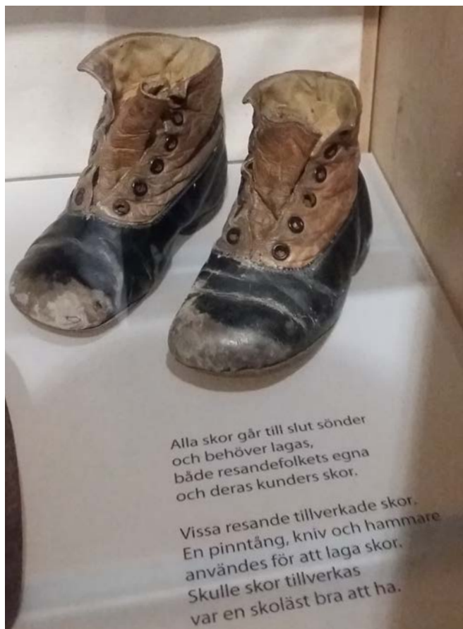
Barnskor i en monter som visar resandefolkets skomakarverktyg och lagade skor.

slitna läderkängor i den monter som visar skomakeri som yrke. Även om barnskon här illustrerar skomakeriet som ett nödvändigt hantverkskunnande och som en möjlig inkomstkälla för resandefolket, så kan intersektionen mellan ålder och etnicitet ske i besökarens meningsskapande. Även om just dessa små skor förmodligen inte tillhört ett barn ur resandefolket fick de mig som besökare att fundera över hur det var att växa upp som resandebarn under 1900-talets första hälft.