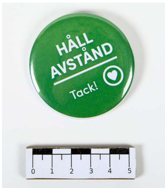
Rockmärke "Håll avstånd tack" använt av personal på stadsbiblioteket i Varberg och förvärvat till Hallands kulturhistoriska museer.

hundra år tidigare så blev det startskottet för förändringar som en förbättrad sjukvård (DOSS Ambrosiani 2022).