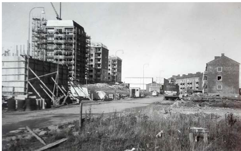
Antenngatan under uppbyggnad omkring 1953.