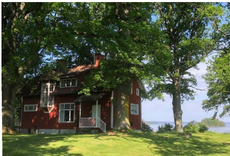
Ekudden under ekarna vid Glan, juni 2021.

och döttrarnas uppgift. Men det dröjde ända till 1970-talet innan någon man på allvar gjorde sig besvär i köksavdelningen.