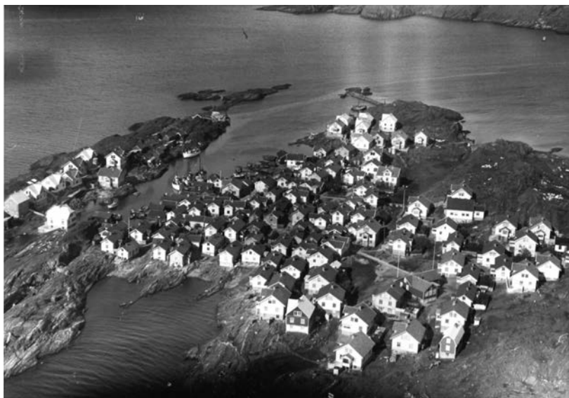
Flygfoto över fiskeläget Åstol 1934.

Vid en förnyad fältundersökning 2011 och 2012 fann jag helt andra förhållanden på Åstol. Sommarhusägarnas antal hade stigit markant och pingstförsamlingens inflytande över livet på orten hade minskat. Det hade skett en stark utflyttning av yngre bofasta invånare under de föregående åren till följd av det kraftigt minskade fisket. Andelen sommarhus hade ökat till strax över hälften av de totalt omkring två hundra husen. 2011 fanns endast fem barnfamiljer kvar och skolan hade stängts. Åldersstrukturen hade skjutit i höjden. Genom denna utveckling hade medlemstalet i pingstförsamlingen minskat betydligt. De nytillkomna sommarboende engagerade sig knappast inom församlingen, men de försökte att respektera de tidigare centrala normerna gällande söndagsvila och att ta avstånd från bruk av alkohol. Vissa sommarboende berättade att de inte gärna ställde en vinflaska på sin altan eller veranda där det fanns insyn för förbipasserande i det tätbebyggda lokalsamhället. Sådana försiktighetsåtgärder från sommargästernas sida bidrog till att jag inte kunde märka några öppna konflikter utan i stället vissa former av samarbete. Både sommar-