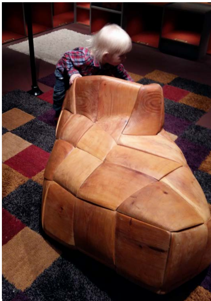
Barn i snidad sko i utställningen Tillsammans.

museerna är sprungna ur idén om ett gemensamt kulturarv, och de präglas av sin samtids behov och värderingar, samtidigt som det som visas upp i museernas utställningar är tolkningar av dåtid. Museerna som institutioner där många olika röster, historier och kulturarv ska representeras har diskuterats under en längre tid, men frågan om vilka som upplever att museet är till för dem är