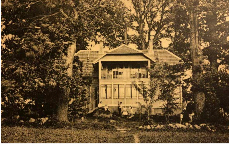
Ekudden från sjösidan, omkring 1910.

också sång och musik egenhändigt, men numera är det sällan någon som spelar på pianot med jugenddekor. Sällskapsspel och krocket har dock fått en renässans på senare tid, vilket är en fröjd att se i detta uppkopplingens tidevarv, då datorer och smarta telefoner tycks fånga folks uppmärksamhet nära nog dygnet runt. Den svart-vita tv som var en modernitet år 1971 ter sig nu närmast antik.