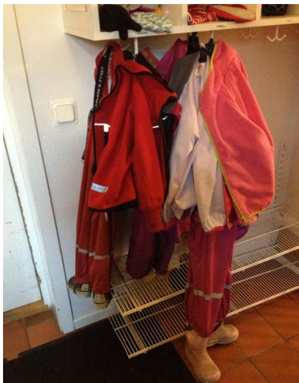
Flickors kläder i kapprummet.

utbrast t ex en pojke (15 nov F1). Det var vanligt att barn behövde hjälp med att stoppa den nedersta platta delen från ena sidan av delbara blixtlås tillräckligt långt mer i skåran på den andra sidan, för att kunna sätta igång med att dra upp blixtlåset. Det skyddande tyget som ofta finns bakom blixtlås var ett annat problem eftersom det ofta kom i vägen och fastnade i blixtlåset.