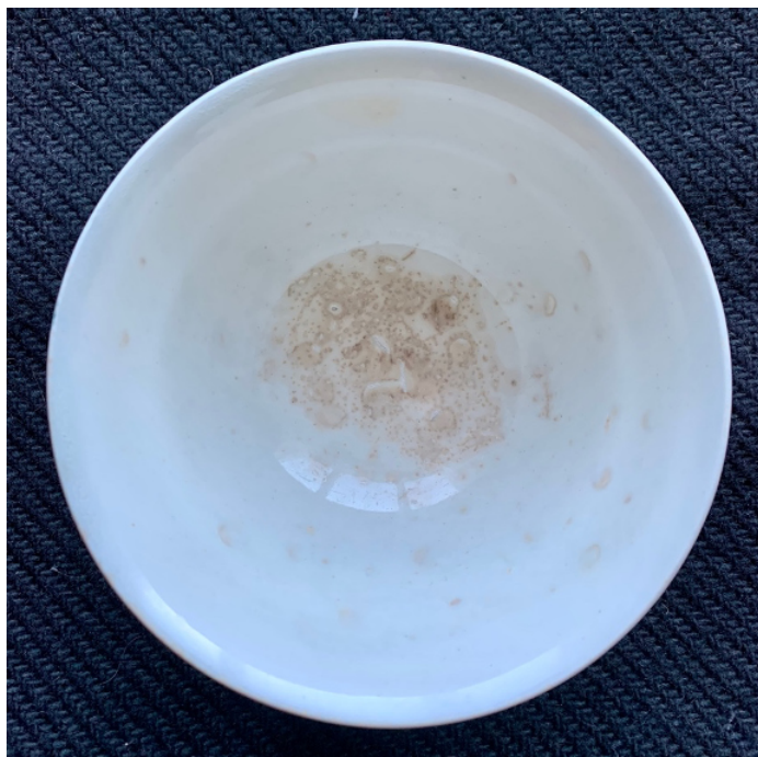
Skålens botten har missfärgning under glasyren.

der som beskrivits ovan. Mönstret ser tydligare ut, linjerna bryts inte. Är skålen i min ägo ett misslyckat exemplar, eller en prototyp av något slag?