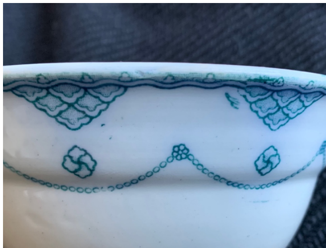
Skålen Öresund. Skarven mellan mönsterbårderna.

I botten finns en stämpel i samma blågröna färg som dekoren, föreställande ett stockankare med en tvinnad tamp i ankarets övre ögla. På en halvcirkelformad banderoll står Gustafsberg (stavat med f) textat med tidstypiska gemener, medan en horisontell banderoll över den anger servisens namn, ÖRESUND, med versaler. Strax ovanför stämpeln en fördjupning porslinet, siffran 0 inpressad i den då fuktiga leran.