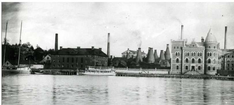
Gustavsbergs hamn efter år 1897. I förgrunden ses ångbåten Gustavsbergs VI.

holm hade förbättrats. Gustavsberg var fortfarande ett brukssamhälle, om än inte lika isolerat från omvärlden (Wikander 1988:40f).