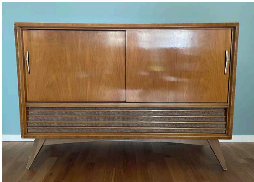
Radiogrammofonen där den står placerad idag.

dem som växte upp med den under åren som följde på att den införskaffades. I den här artikeln vill jag därför ta tillfället i akt att fokusera på radiogrammofonens roll och funktion under senare delen 1950-talet utifrån en ung persons synvinkel. Detta har jag nu för avsikt att undersöka genom att intervjua min svärmor Inger som är född 1944 och som var i 13–14 årsåldern när medieapparaten köptes in.