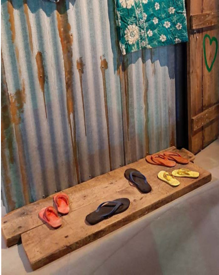
Bilden visar skor utanför ett hem i utställningen Textil kraft.

ting från det förflutna till något högst fysiskt som gör det förflutna verkligt (jfr Feldman 2006).