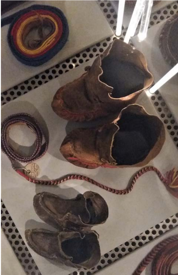
Barnsko i utställningen Sápmi på Nordiska museet.

har interaktionen mellan människa och ting många dimensioner, och det är tydligt att museet har försökt navigera mellan de frågor som var aktuella när utställningen kom till. Den samiska samlingen, och utställningen Sápmi , behöver därför sättas in i en kontext där frågor om ursprungsbefolkningars rättigheter inte enbart