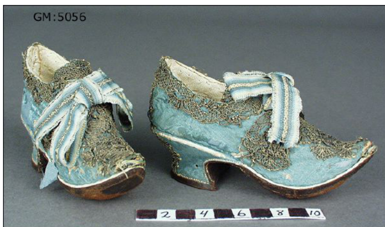
En barnsko i siden med spets. Bilden tillhör Göteborgs stadsmuseum och är hämtat från databasen Carlotta.