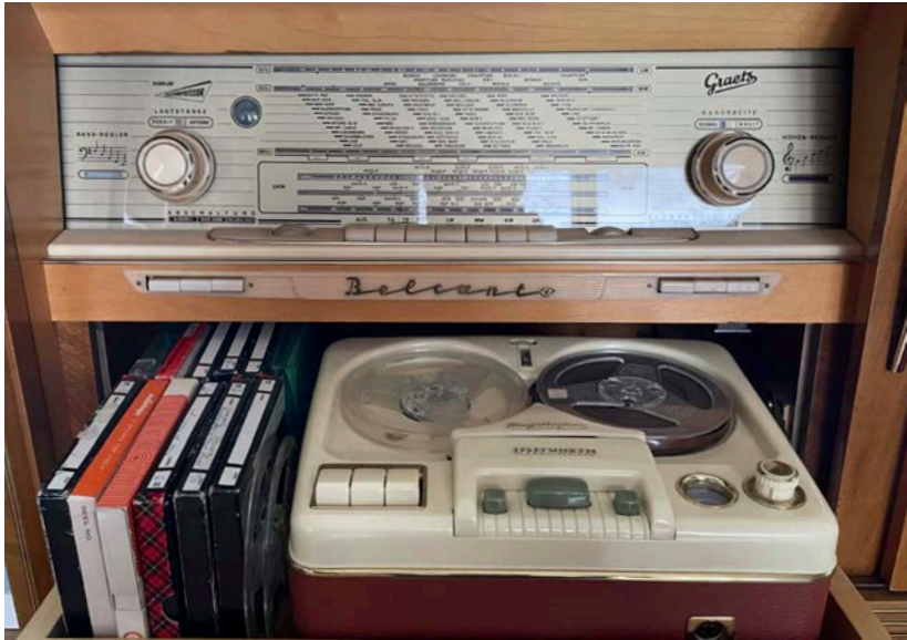
Bakom den vackra valnötssluckan återfinns bandspelaren och rullband.

som att sprida ljudet till fler rum och göra det möjligt att lyssna på fler platser än i vardagsrummet: