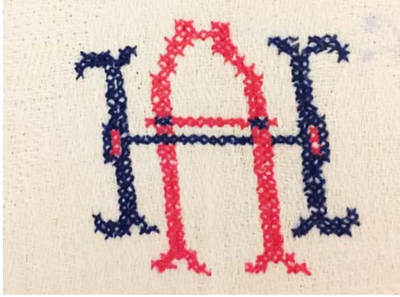
”HA” – monogram i korsstygn.