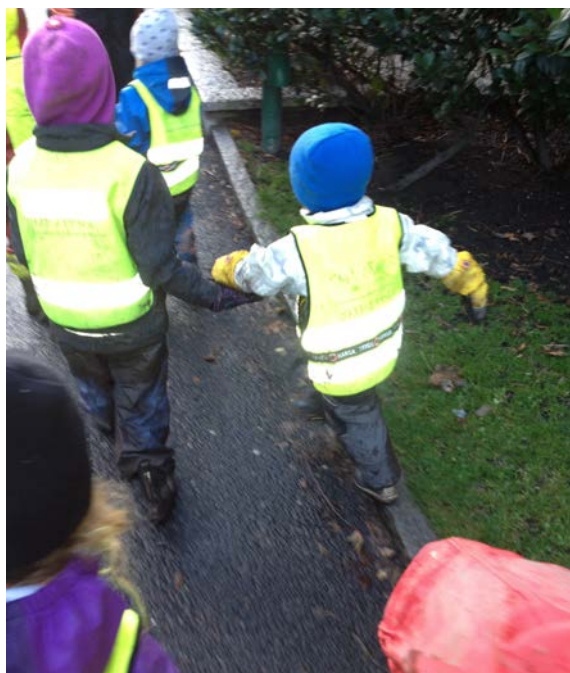
Promenad till parken i de neongula västarna.

fälle då en flicka begav sig en bra bit bort i parken. Då sade nämligen den i personalen som hämtade tillbaka henne: "Tur att hon hade väst! Man ser dem då, när de springer längre bort än de får" (12 sep F1).