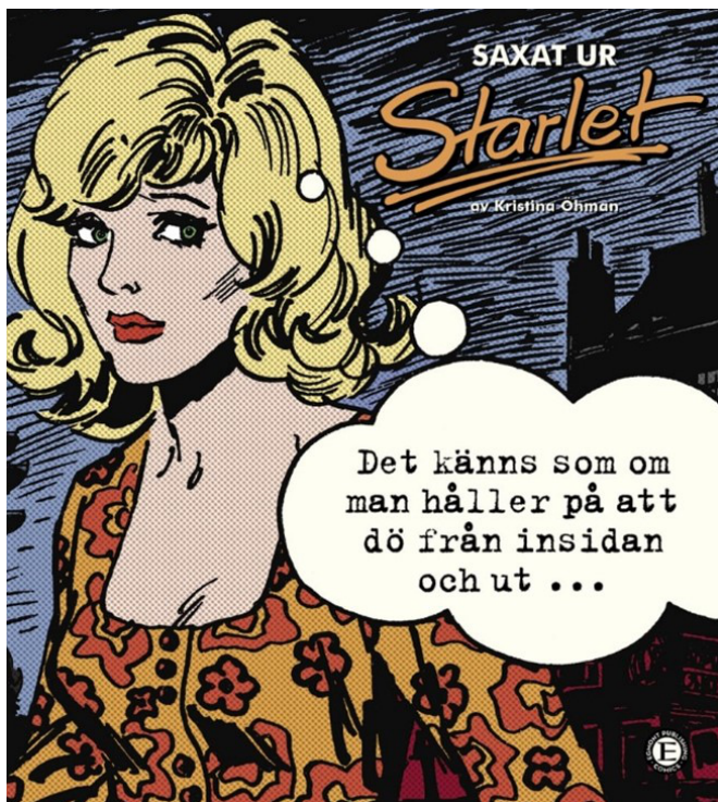
Boken Saxat ur Starlet kom ut 2019, och innehåller ett urval av bilderna från @tidningenstarlet.