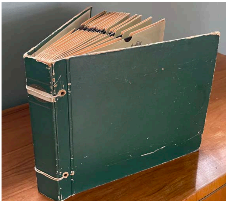
Stenkakor förvarade i specialtillverkade band med plats för 15 skivor.

inom hemmets väggar förefaller dock inte den nya rockmusiken ha genererat. Föräldrarna förefaller ha varit uppmuntrande till all typ av musik och har också ombesörjt inköp av ett flertal skivor med de nya rock'n'roll-artisterna. Men samtidigt som rock'n'rollen gör sitt intåg i Ingers vardag som tonåring lever minnen från barndomens musikupplevelser kvar, både i form av musik som hon och andra i familjen lyssnat på och från låtar som hennes pappa sjungit i olika vardagliga situationer i hemmiljön. Så att 1950-talet utgör en brytningstid bekräftas av Ingers minnen från uppväxten i en musik-, ljud- och medieteknikintresserad familj.