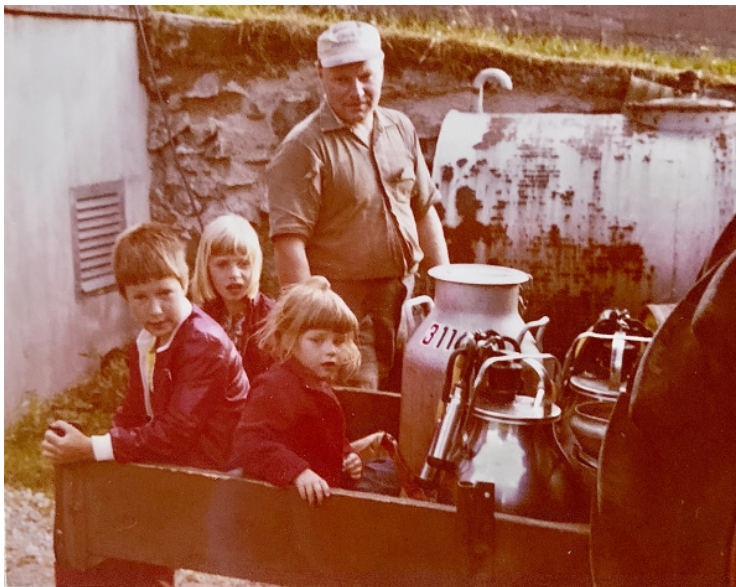
På väg till kvällsmjölknigen, tidigt 1970-tal. Författaren nr två från vänster.