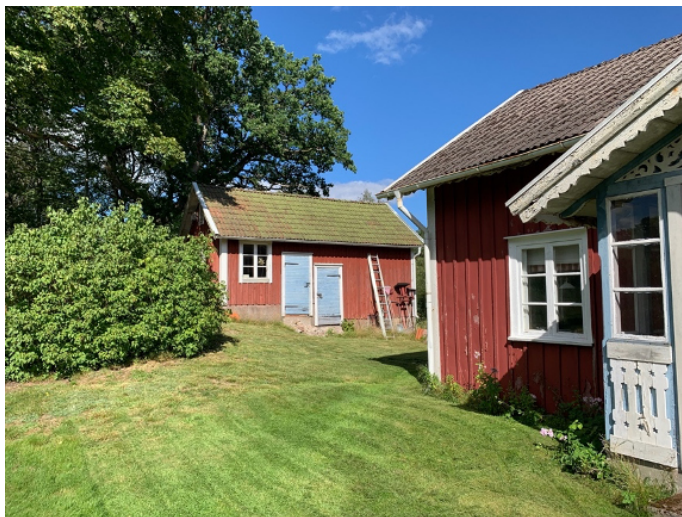
Torpet Skalleved år 2020.