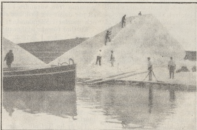
Det är inte snö — det är salt.

På många platser i Europa får man salt ur bergen, men i Italien m. fl. stäl-