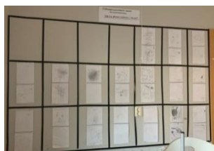
Barnens på avdelningen "Safiren" ritningar av deras önskingar om förändringar i ateljén.

idéer och att deras stöttning gjorde att barnen vågade uttrycka sig verbalt om sådant de ville förbättra.