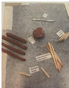
Uppdukning/iscensättning av aktion med rödlera på avdelningen "Safiren".

barnen berättade om det de skapat. De delade även materialet med varandra så att alla barn fick möjlighet till att vara delaktiga och använda sig av allt material. Pedagogerna använde både verbal och icke-verbal kommunikation för att möta barnens olika behov.